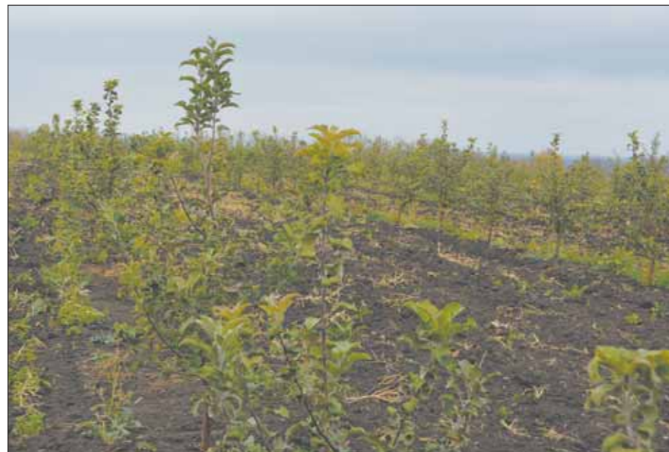
В будущем году ожидают получить первый большой урожай яблок