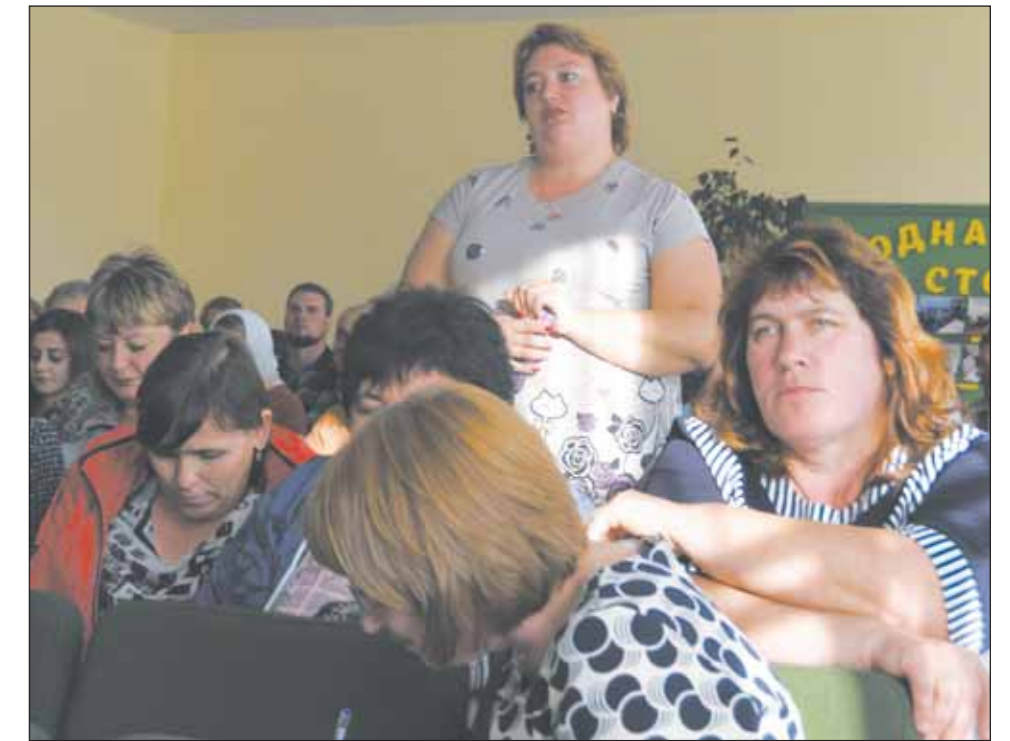
На встрече вопросы чаще всего задавали жительницы поселения

— Будет сделано так, как в Данцевской школе, нужно немного подождать, — обратился он к участникам встречи.