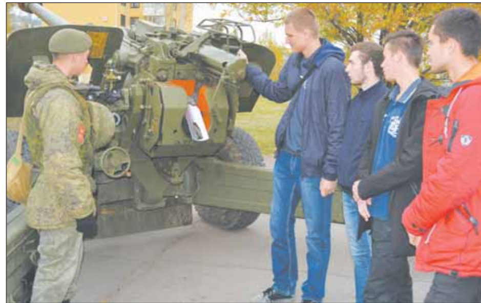
О военной технике ребята хотели узнать как можно больше