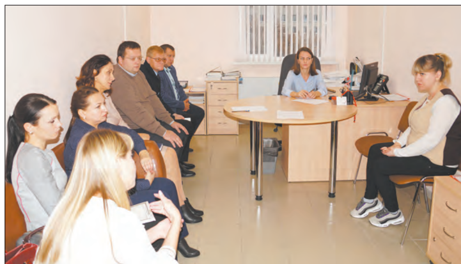
■ Каждый вопрос требовал обстоятельного ответа

На приеме граждане задавали волнующие их вопросы, среди которых особенно остро стояла проблема обеспечения детей-сирот жильем – на прак-