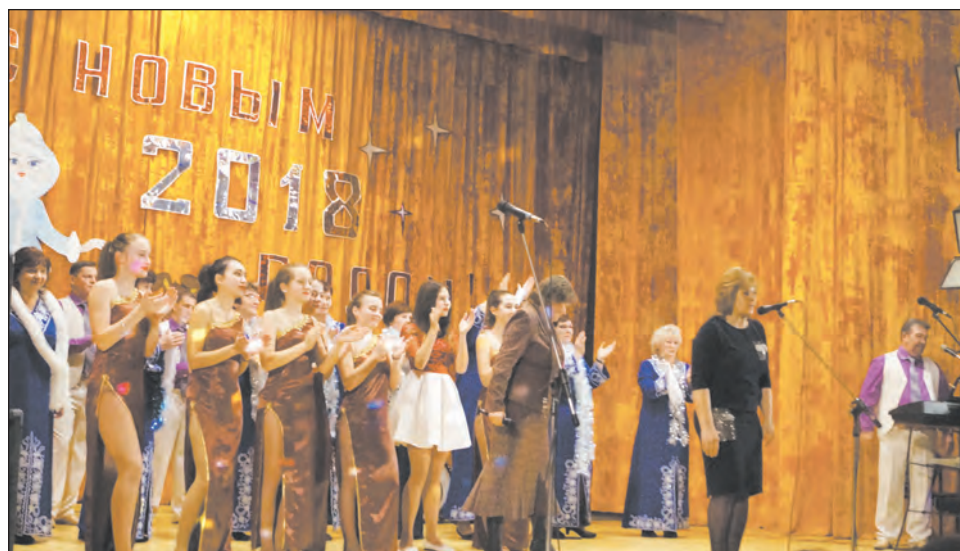
В художественной самодеятельности Радченского СДК активно участвует молодежь.