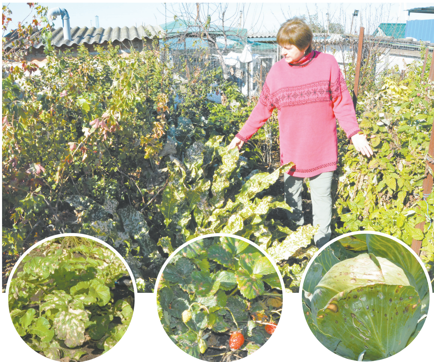
Поврежденные листья редиса

Сельчане уверены, что это результат воздействия химического вещества, которым обрабатывали поля