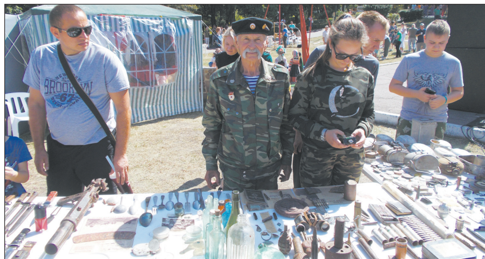
Поисковики заинтересовали воронежцев представленными экспонатами