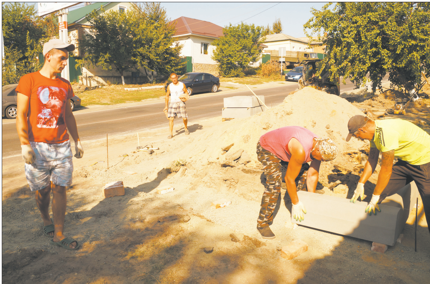
До окончания работ по обустройству тротуаров осталось чуть более месяца. Но случится ли это в реальности?