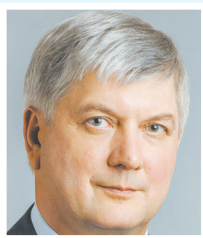
Александр ГУСЕВ, ГУБЕРНАТОР ВОРОНЕЖСКОЙ ОБЛАСТИ.

(На торжественной церемонии принятия присяги на верность Конституции РФ и Уставу Воронежской области 15 сентября):