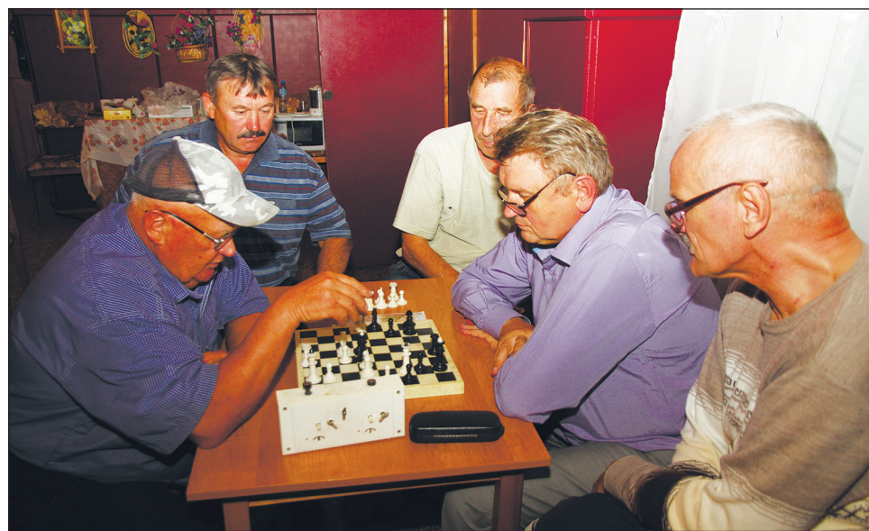
Напряженный момент игры

Призеры получили денежные премии, участники, занявшие первые три места, награждены ценными подарками, дипломами и медалями.