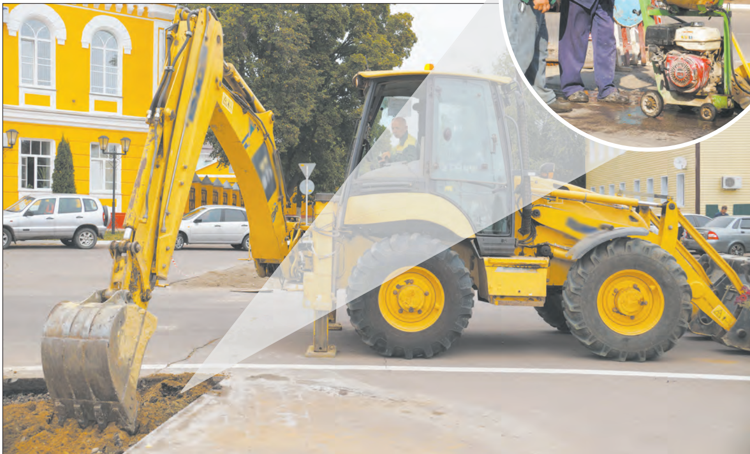
На главной площади города заканчивается замена теплотрассы

В Богучаре и поселениях района активно ведутся работы по благоустройству территорий