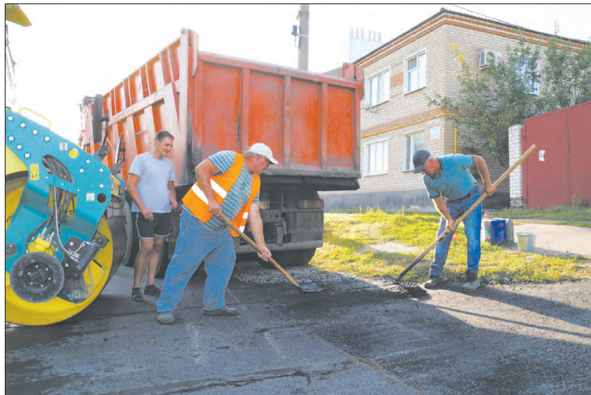
Работы ведутся на улице К. Маркса в Богучаре