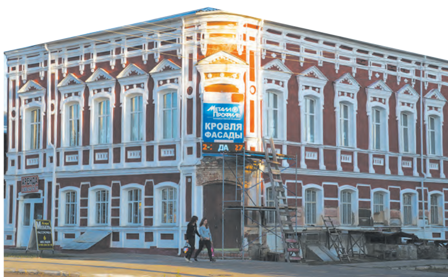
■ Так теперь выглядит здание бывшего пищекомбината