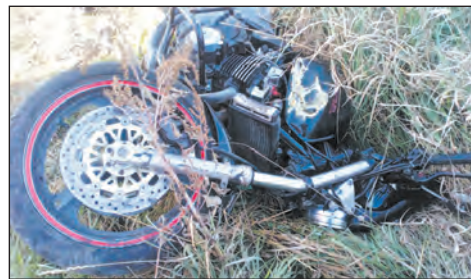
■ На месте происшествия

В случае, если подросток становится участником ДТП, сотрудники полиции вправе привлечь его родителей к административной ответственности, предус-