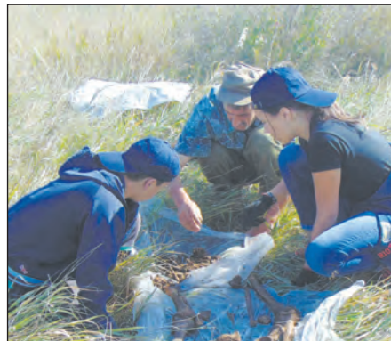
К поиску приобщаются и дети

– Мы использовали миноискатель. Он дал сигнал, мы начали копать. Нашли останки человека и советскую каску, пробитую пулей. Рядом с солдатом ле-