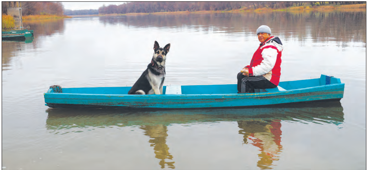
Лорды тоже любят порыбачить