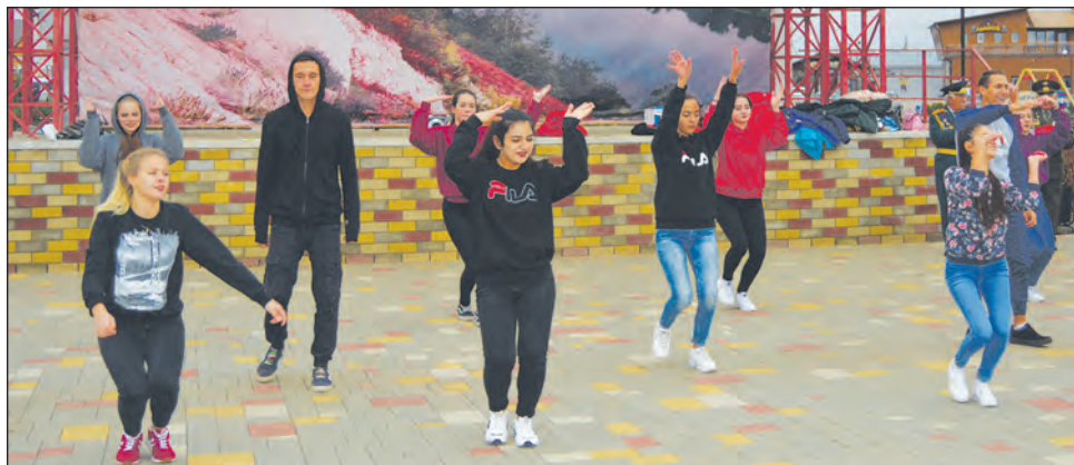
Флешмоб на набережной

Богучарские школьники провели акцию в поддержку здорового образа жизни