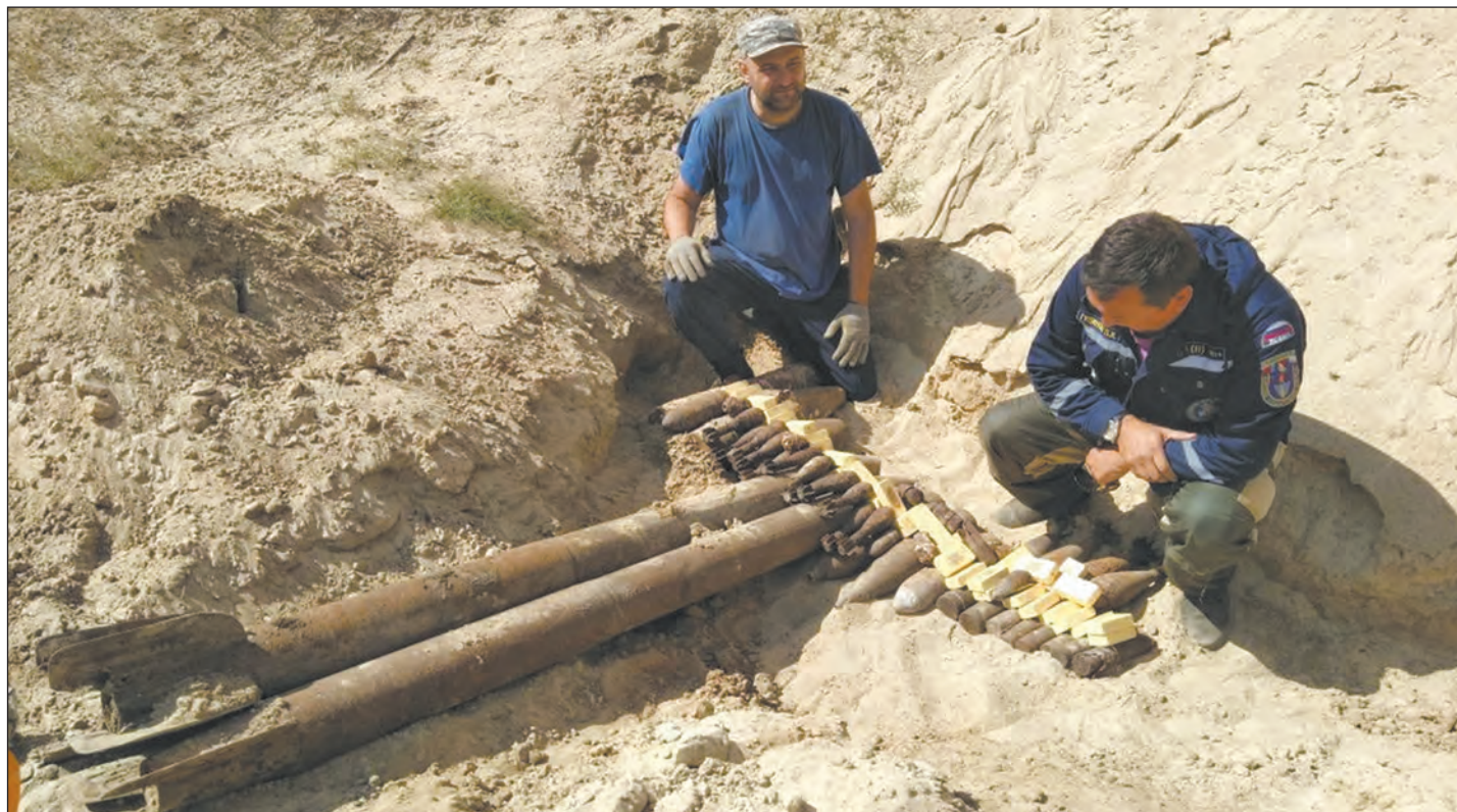
Снаряды Великой Отечественной войны в Богучарском районе находят до сих пор