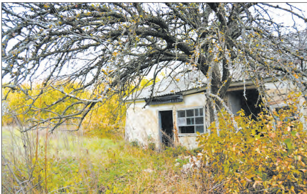
Нет ничего вечного

воровкин. — В селе была начальная школа, магазин, клуб. Словом, всё как у людей. В клубе часто «крутили кино». Правда, медпункта своего у нас не было, приходилось обращаться в Ближнюю Горку или в Сухой Донец. А таблетки, лекарства заказывали почтальонке. Восьмилетняя школа была в Сухом Донце, а десятилетка — в Монастырщине.