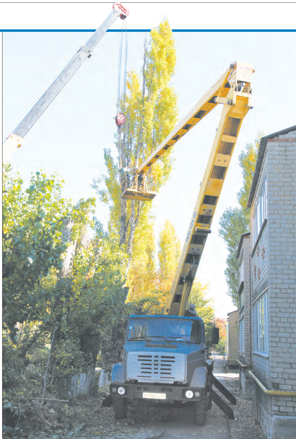
■ Тополя спилить не так просто