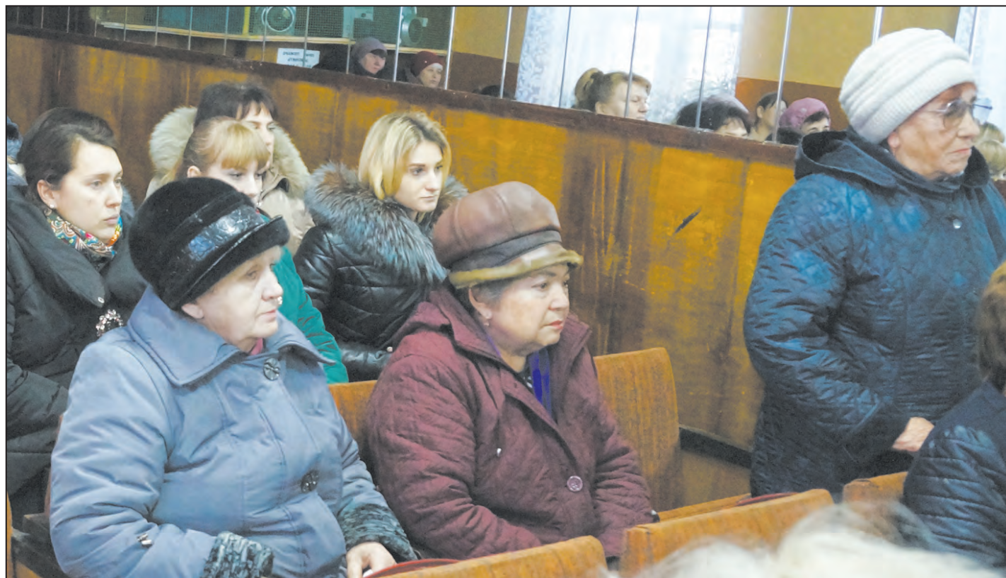
■ Некоторые вопросы селяне ставили остро

В 2019 году к богучарцам «придет» «Бережливая поликлиника»