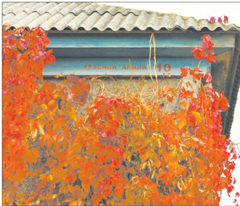
В этом доме жили Сурувикины

Когда мы дошли до конца улицы, то решили пройти ещё чуть-чуть, в поле, и не пожалели об этом. Наверху мы обнаружили сельское кладбище, окружённое неболь-