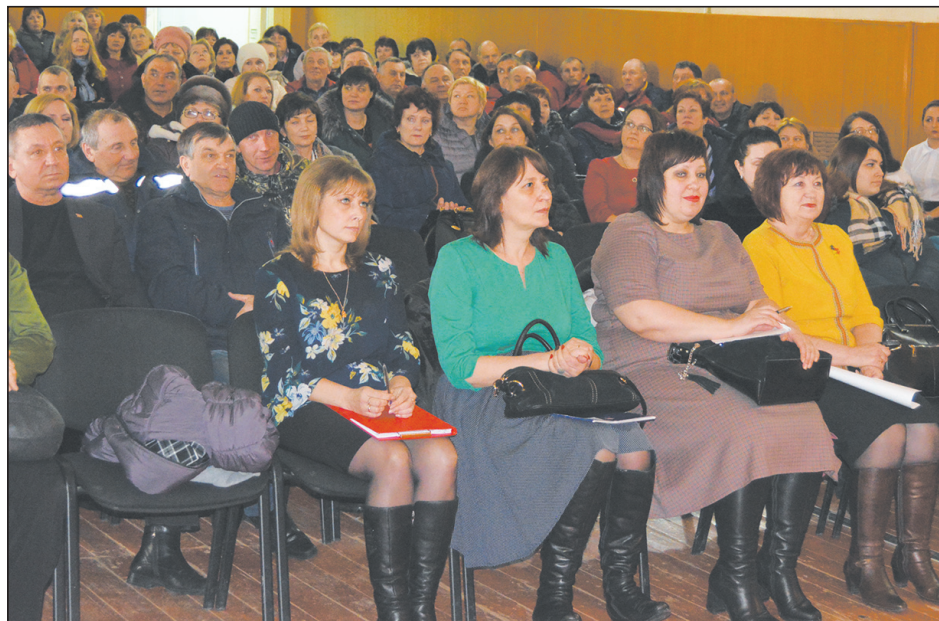
На первую встречу пришло более 100 человек