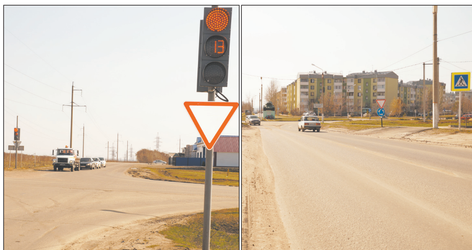
На улицах Транспортной и Танкистов движение стало более упорядоченным и комфортным

Михайлович, дело все же продвигается. В конце прошлого года отремонтировали дорогу на улице Танкистов от пересечения с улицей Транспортной до автомобильного кольца на въезде в военный городок.