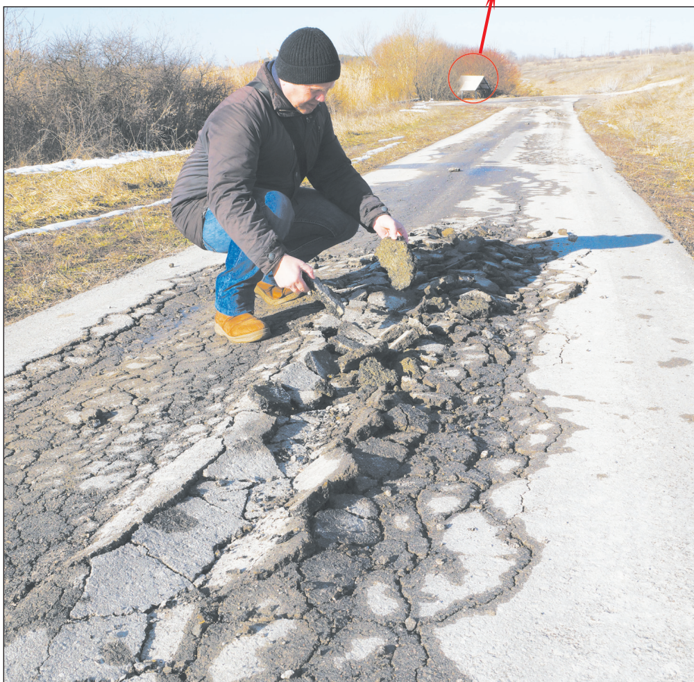
Так выглядит разрушенный участок дороги