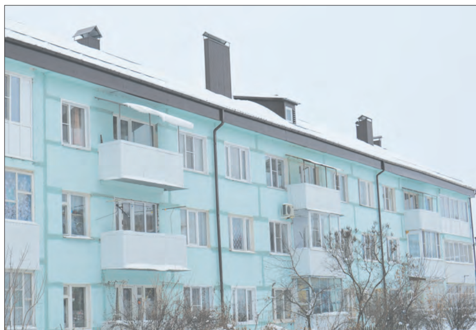
■ Так выглядит обновлённая кровля на доме №35 по улице Карла Маркса в городе Богучаре

При этом региональный оператор последовательно расширяет практику принудительного взыскания долгов по взно-