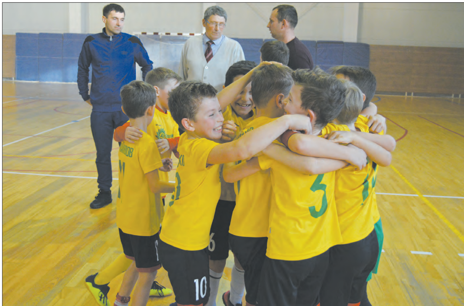
Первые эмоции после долгожданного выигрыша в финальной встрече

Прошли межрайонные соревнования по мини-футболу памяти Андрея Пидько