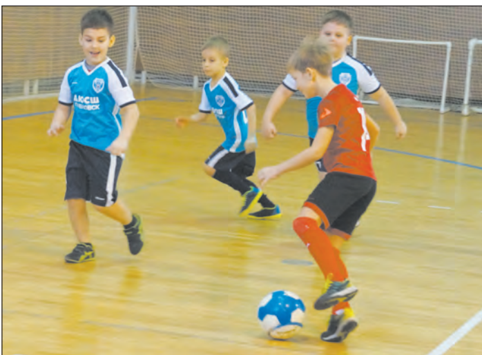
Острый момент игры