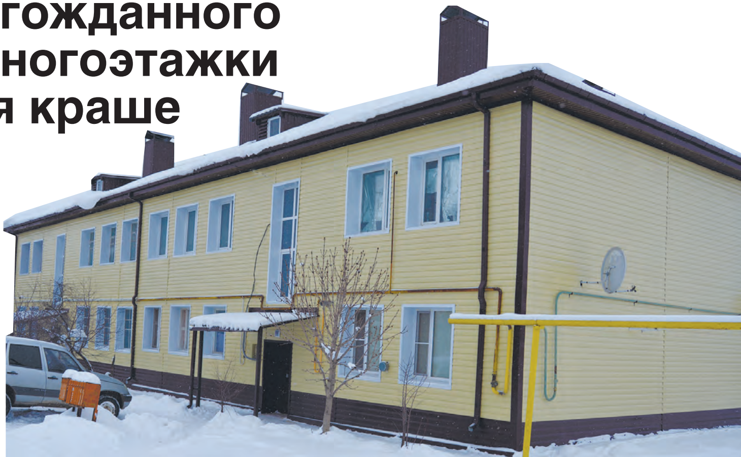
■ Отремонтированный дом №56 по улице Ленина в селе Купянка

В восьми многоэтажках Богучара тоже произошли позитивные изменения. В домах №31, №33 и №38 по улице Карла Маркса за счёт средств регионального оператора рабочие заменили инженерные сети. В домах №10 по улице 1-е Мая и № 182 по улице Дзержинского ремонтники полностью заменили ветхую электропроводку и систему общедомового электроснабжения, установили современные электрощиты и датчики движения в подъездах. Всё это позволит экономить электричество в местах общего пользования.