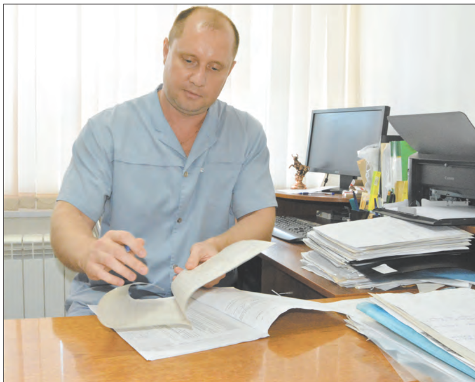
■ На работе хирург проводит иногда по несколько суток

– Как говорится, кто не работает, тот не ошибается. Мы стараемся свести к минимуму такие случаи. А если ошибка все же происходит, то тщательнейшим