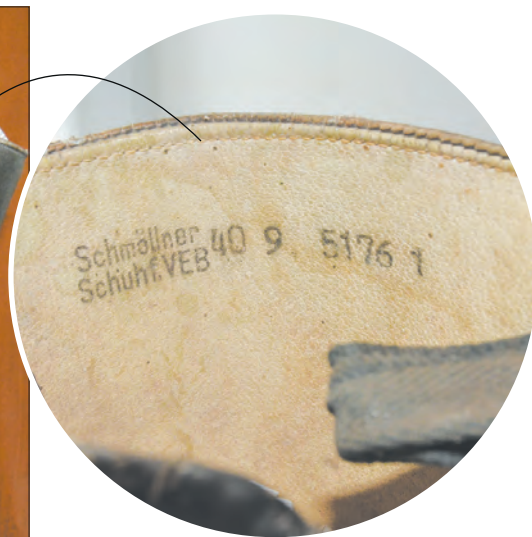
■ Голенища в идеальном состоянии