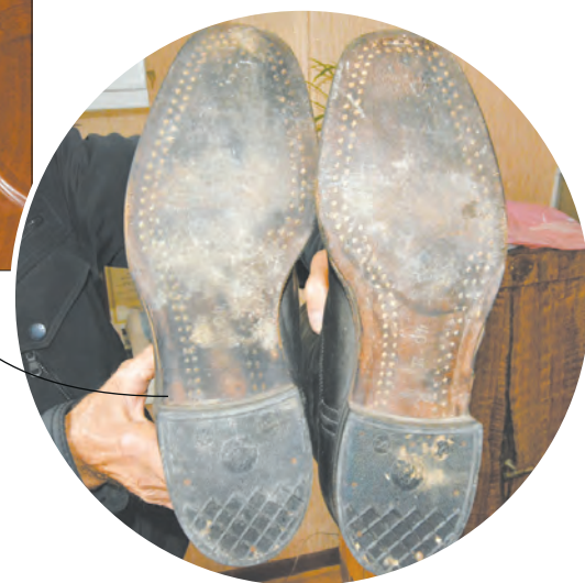
■ Подошва сапог не стоптана