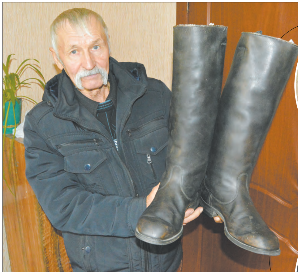
■ Сапоги, которым больше 75 лет, пополнят экспозицию Дубравского музея

Однако явное отличие от увиденных ранее было – эти оказались в отличном состоянии: кожа мягкая, практиче-