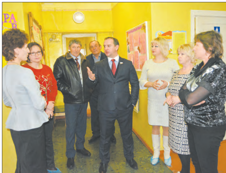
Во время визита законодатель узнал о том, какие еще проблемы имеются в учреждении