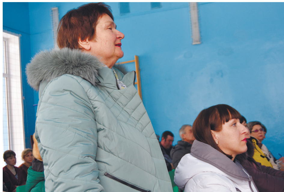
Селяне проявляли активность

Чтобы во всех сёлах поселения организовать качественное освещение, по статье «Расходы на уличное освещение» запланировано приобрести 400 светодиодных энергосберегающих светильников. Свыше двухсот уже установлено на месте устаревших и неисправных, остальные будут монтироваться весной. С водоснабжением сёл также проблем не было, в Подколодновке и Журавке справлялись собственными силами, в Старотолучеево поставкой воды с 2014 года занимается МКУП «Богучаркоммун-