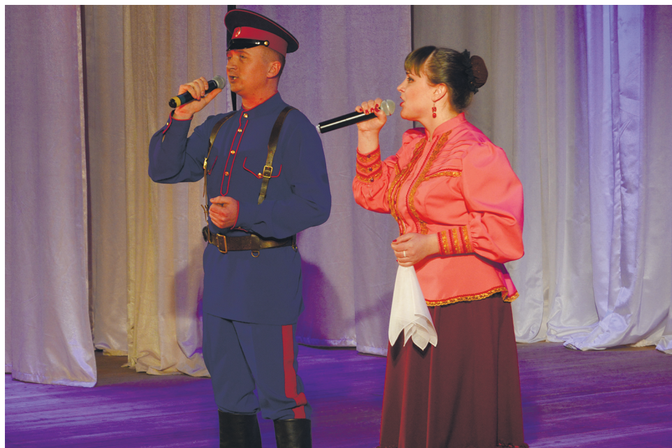
Со сцены звучали и казачьи песни

Ветераны ВС, участники афганских событий встретились с учащимися Залиманской и двух Богучарских школ. Они рассказали школьникам о хронологии событий Афганской войны. Ребята узнали о подвигах и быте солдат, потерях сторон в боевых действиях.