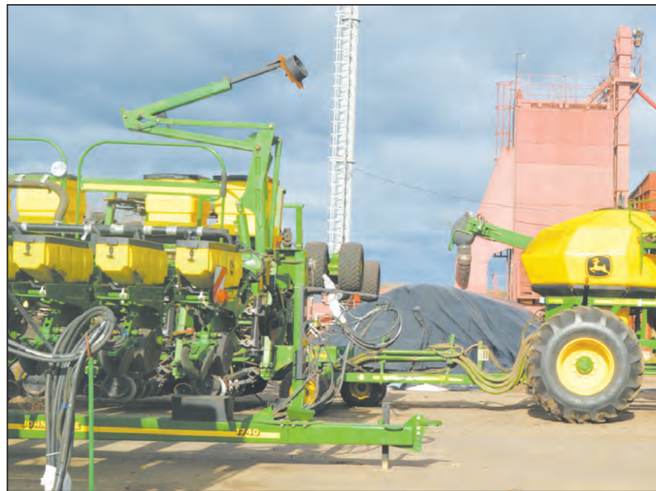
Новая техника готова к работе