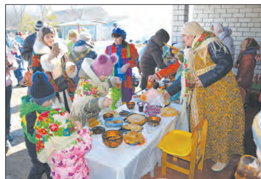
Блины были вкусные и ароматные

Не обошлось и без проделок Бабы-Яги, которая хотела подменить собой красавицу Весну и помешать проводить праздник. Но ребята справились с ней и с ее сообщником Соловьем-