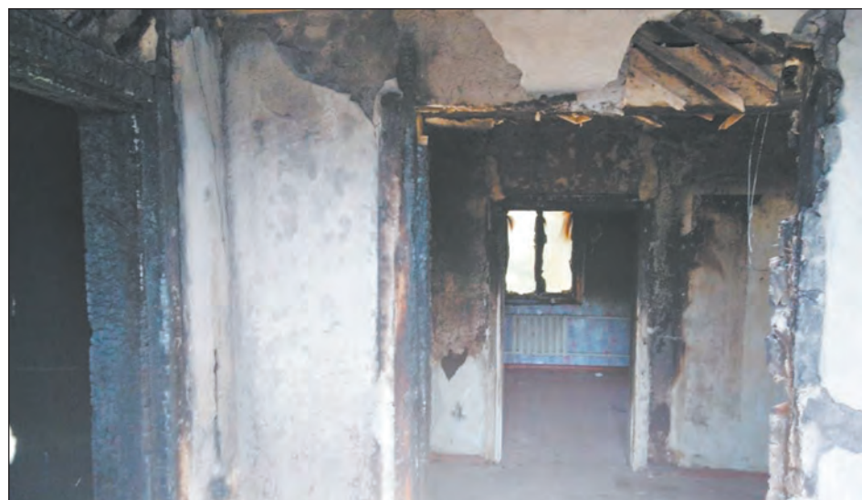
Последствия пожара внутри жилища

Наталия ЛИФИНЦЕВА