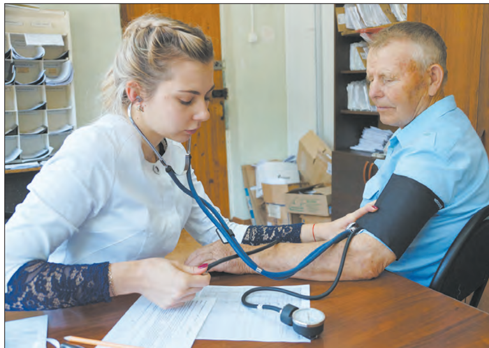
Измерение артериального давления – одна из важных процедур в диспансеризации

– Можно обратиться в кабинет №1 районной больницы (номер телефона