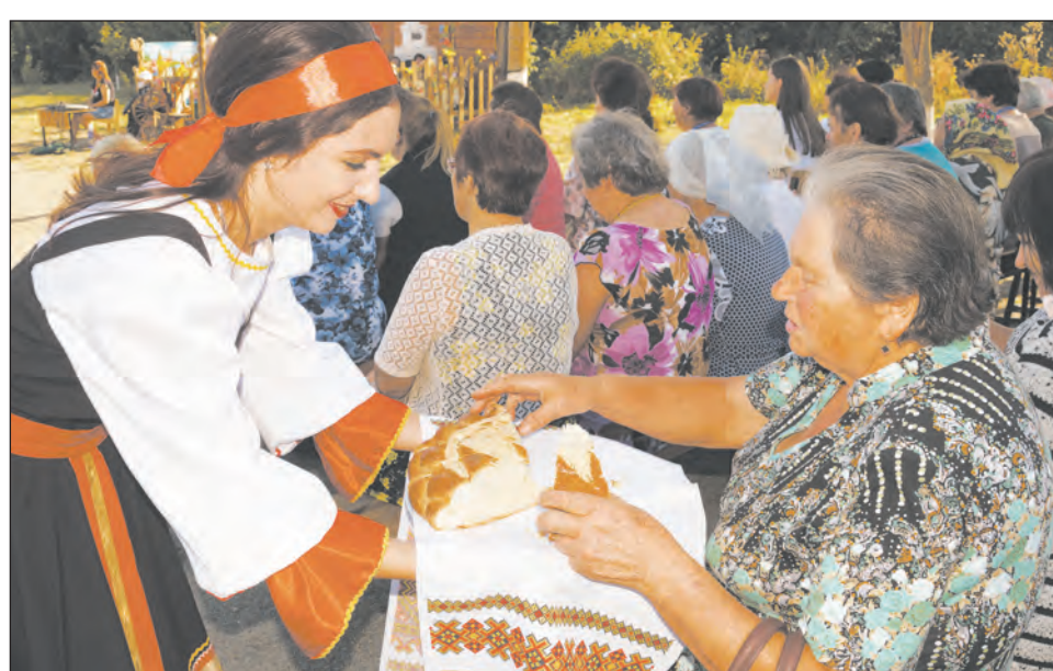
Хлеб-соль гостям фестиваля