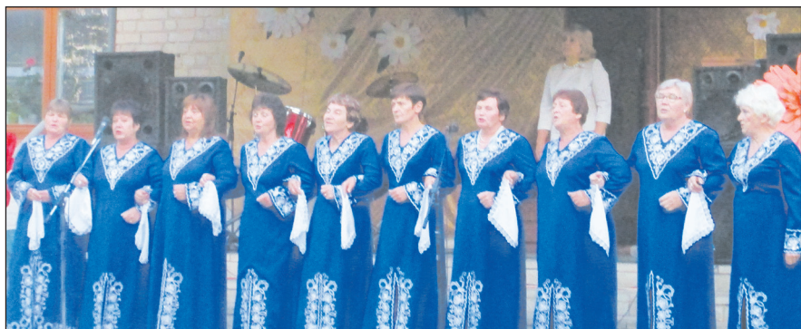
■ В подарок – песня от ансамбля «Ивушка»