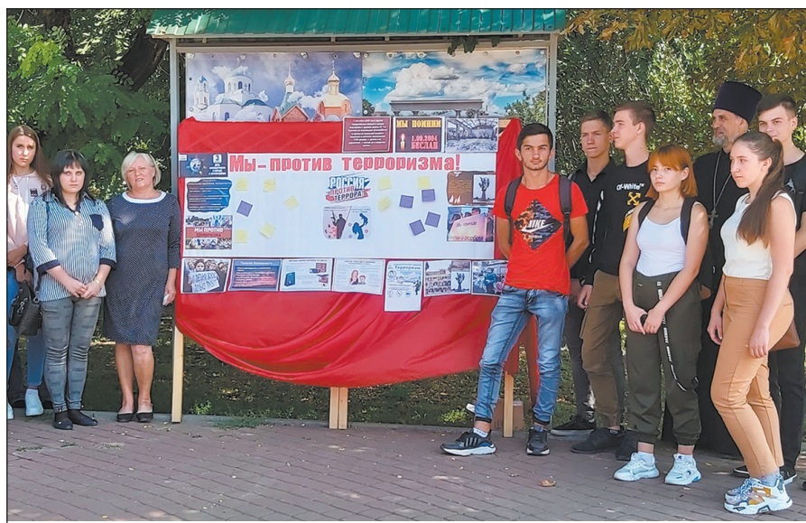
Вот с таким плакатом вышли участники акции в центр Богучара

В Богучаре прошел вечер памяти трагедии в Беслане