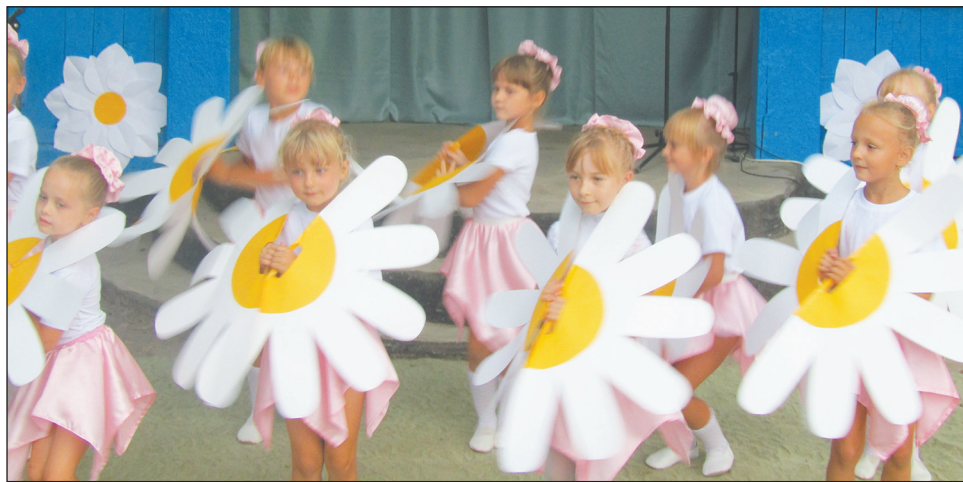
■ На сцене – ансамбль «Ромашки»

Самые громкие аплодисменты достались детским коллективам