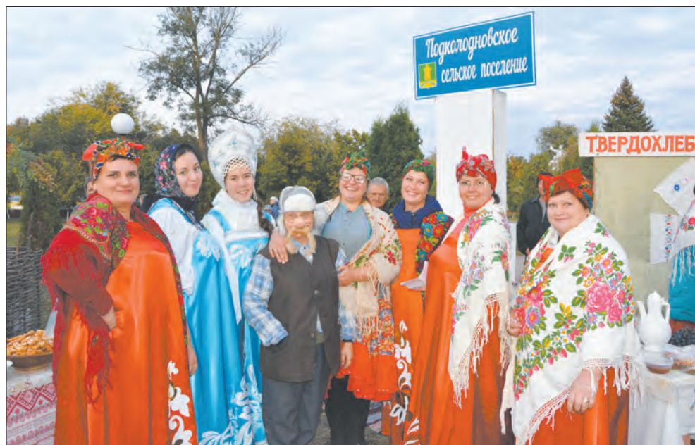
Подколодновцы встречали гостей песнями и сценками