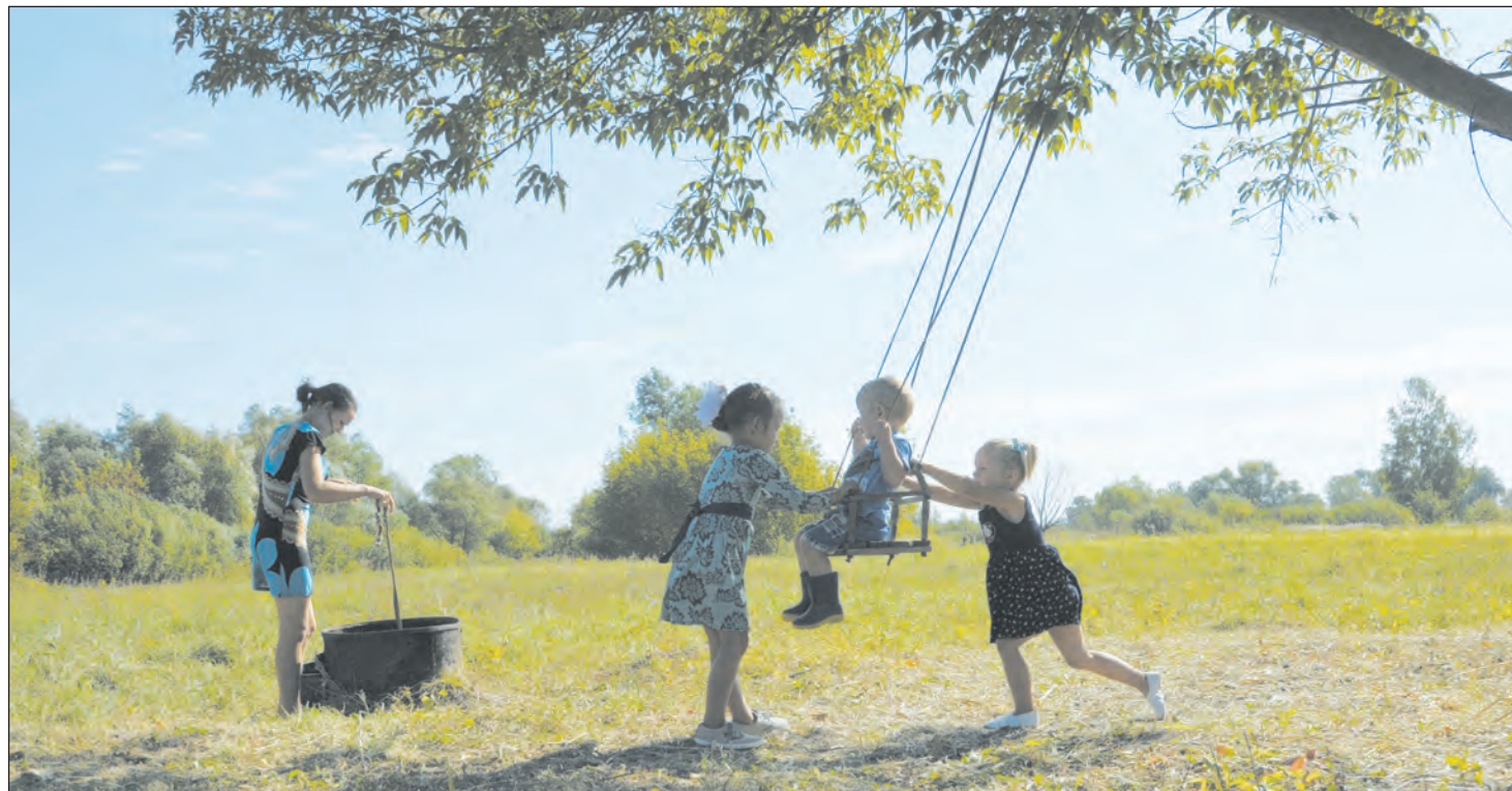
■ Здоровые дети – здоровая нация

Как в Воронежской области реализуют нацпроект «Демография»