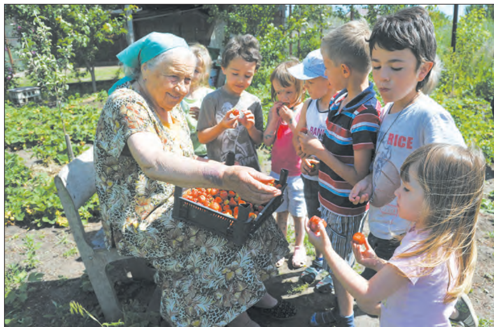
■ И в старости не без радости

Проект «Старшее поколение» направлен на поддержку наиболее уязвимых граждан в солидном возрасте. Районам уже закупили 32 микроавтобуса для перевозки, пенсионеров везут в районные поликлиники.