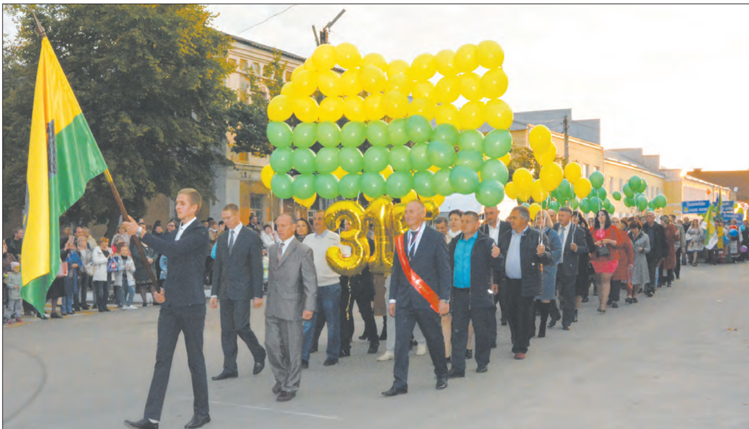
Торжественный парад поселений Богучарского района