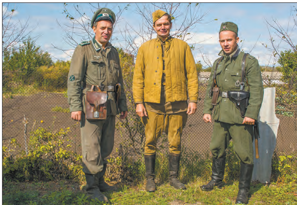
■ Фото в перерыве съемок фронтовых моментов