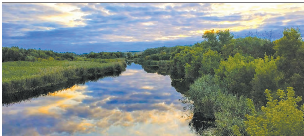
Снимки остальных победителей можно посмотреть в альбоме «Любимый Богучар» в группах «СН» в соцсетях