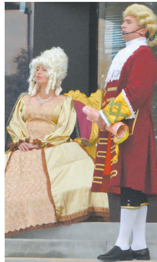
Момент из театрализованной постановки

ба «Эра», приехавшие в Богучар из Белгорода. Богатыри демонстрировали силу молодецкую: они с легкостью подбрасывали в воздух и ловили 16-киллограммовые гири, сгибали железные гвозди и металлические пруты, надували грелку, как воздушный шар.