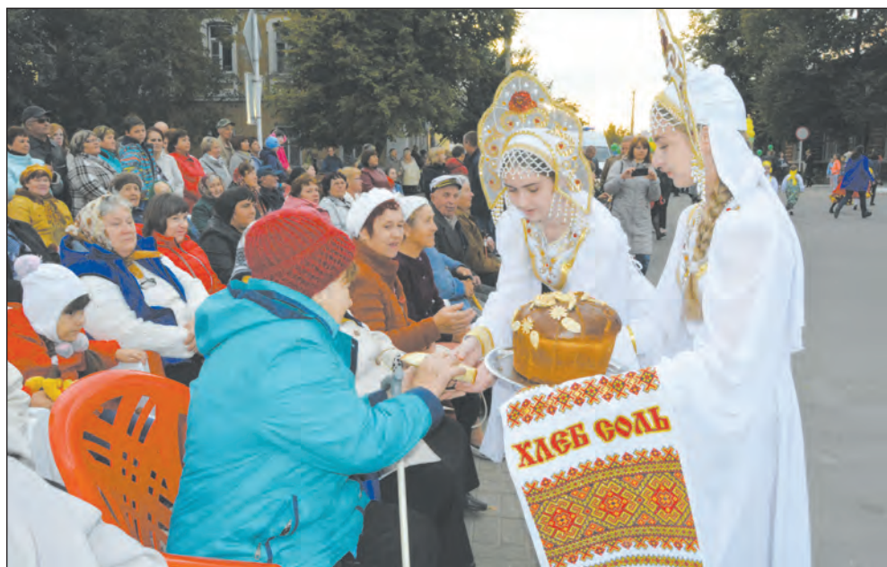
Зрителей угощали хлебом-солью