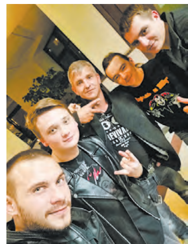
Рок-музыканты из Богучара

Богучарская рок-группа «VARIANT» выступила на IV открытом рок-фестивале «Наш формат», который проходил в Боброве в воскресенье, 27 октября. Музыканты исполнили три песни в разных номинациях: «Авторская», «Кавер-версия» и «Патриотическая». Наши земляков наградили дипломом и памятным подарками.