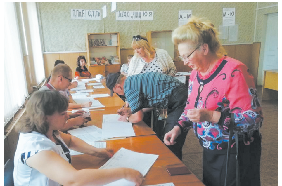
Идет голосование на участке №03/01 в Богучаре

– Явка отвратительная, с ней говорить о результатах сложно. Тем не менее, считаю, что выборы прошли без грубых нарушений – как со стороны избирателей, так и со стороны комиссии их выявлено не было. Мы получили результат волеизъявления людей. Его я оцениваю нормально, люди проголосовали за человека, который знает больше меня, умеет лучше, чем я. Они считают, что при этом руководителе Воронежская область пой-