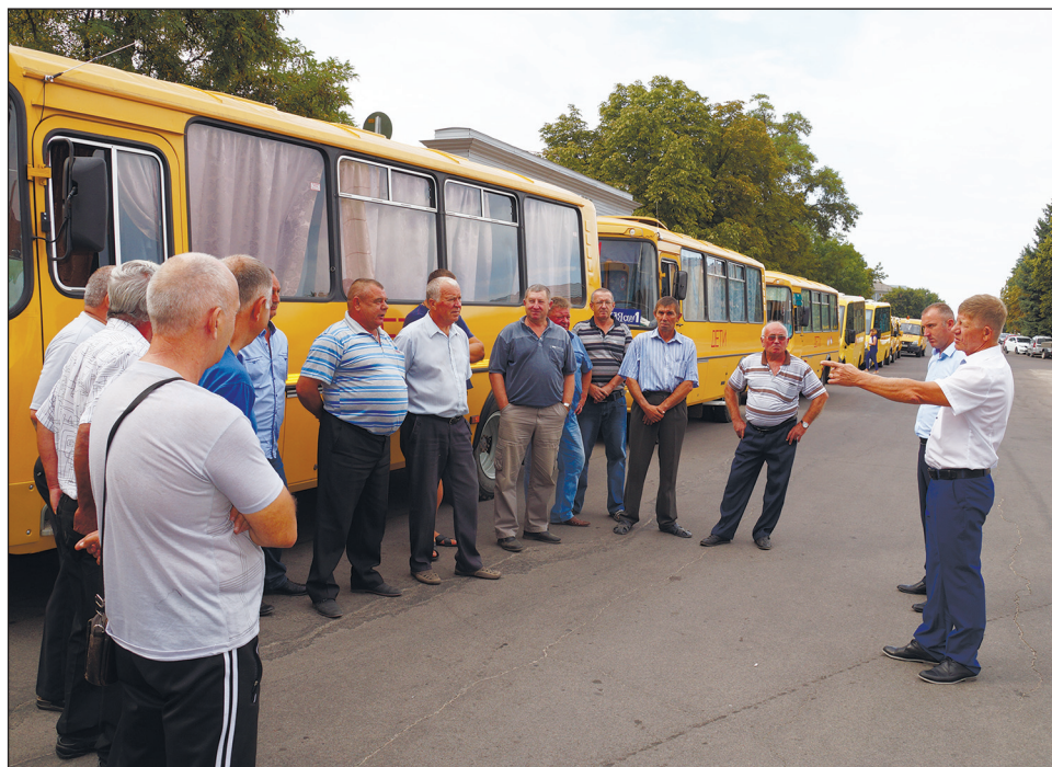
И водители, и автобусы – на линейке готовности