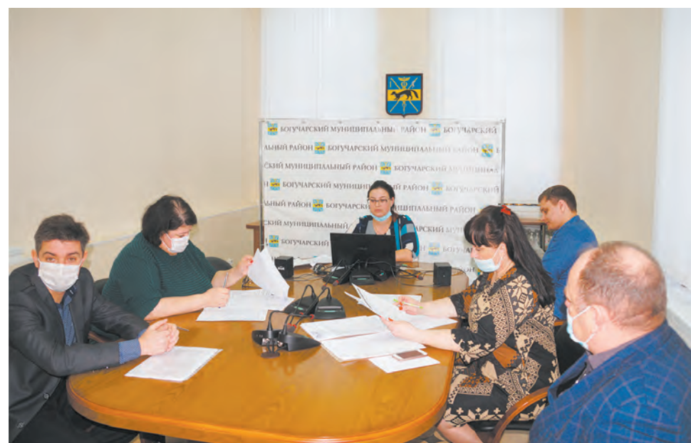
Проект защищают общественники из Луговского сельского поселения

Член конкурсной комиссии, председатель областного общественного совета по развитию ТОС, председатель комиссии по местному самоуправлению, связям с общественностью и средствам массовой информации Воронежской областной