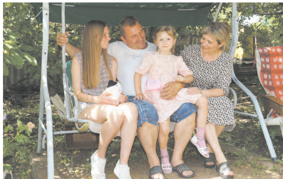
Приятные минуты летнего вечернего отдыха