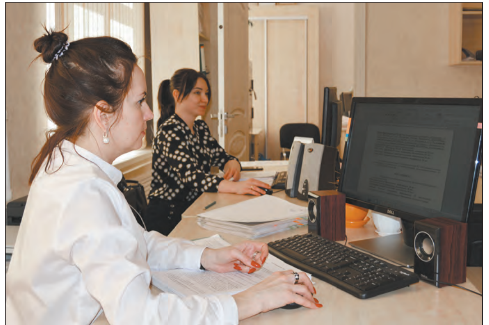
■ Перерасчет социальных пенсий начнется 1 апреля

Увеличение ждет те семьи, в которых получение такого пособия на детей от 3 до 7 лет не позволяет повысить среднемесячный доход до одного прожиточного минимума на каждого члена семьи. Пособие может вырасти в полтора, а если необходимо, то и в два раза. Лишиться выплаты могут «подозрительно бедные» родители. Такие, что предоставляют справки о небольшом доходе, но при этом владеют дорогостоящим имуществом. Например, сравнительно новым автомобилем с мощным двигателем. Право на перерасчет таких пособий в сторону увеличения возникает с 1 января 2021 года. Но подать заявление родители смогут только в апреле. Если право подтвердится, то семьи получат доплату за первые месяцы года.