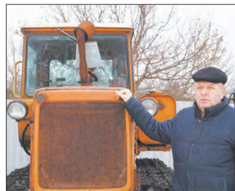
Трактор, с которого все начиналось

В конце февраля 1991 года он написал заявление в земельный комитет о выделении земли для ведения фермерского хозяйства. На ближайшем заседании Василию выделили 32 га на участке, где планировали размещать городскую свалку. После этого он обратился за помощью в областную фермерскую ассоциацию. В рамках так называемого «Силаевского миллиарда», по фамилии тогдашнего руководителя правительства РФ, он получил практически беспроцентный кредит