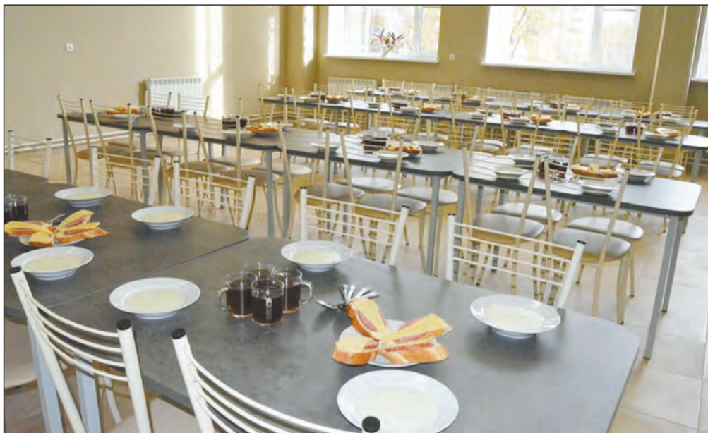
■ Продукты питания в школьные столовые района принимаются по сертификатам качества

Николай: – Как-то в районной газете писали, что в Монастырщине начали ремонт старинного храма. Мы, православные, так радовались, что постепенно христиан-