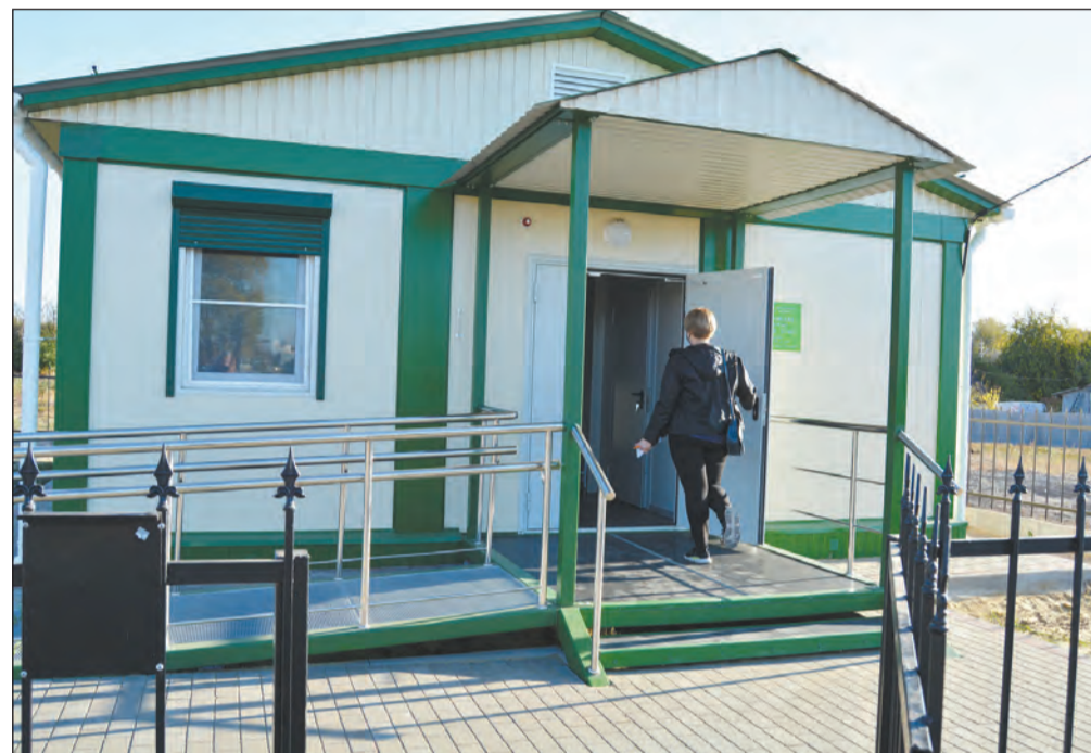
Строительство ФАПов в районе идет по определенному графику. На фото – мед. учреждение в Красногоровке

ра. Хотим вас пригласить в гости к нам, если, конечно, сможете добраться. Мы добираться домой по колено в грязи, на машине не проехать – увязнет. По этому поводу и вопрос: когда же у нас будет асфальт?