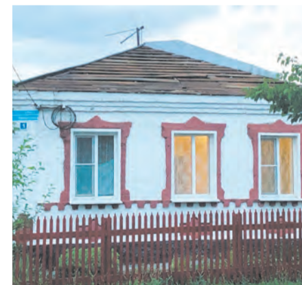
Так выглядел дом после грозы

Помогли починить крышу, сорванную во время грозы