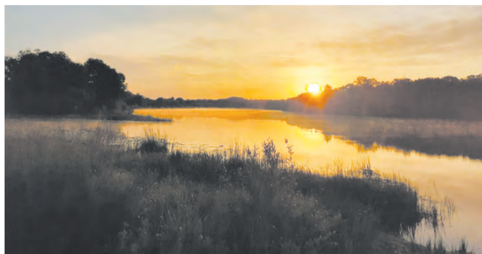
Восход солнца на Дону в Абросимово.