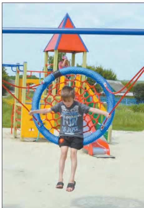
Качели-гнездо особо полюбили дети Свободы

– Мы хотим оборудовать место отдыха у воды. Пруд есть, в центре населенного пункта, но он зарос камышом. Вот мы в ближайшее время хотим начать расчищать территорию собственными силами,