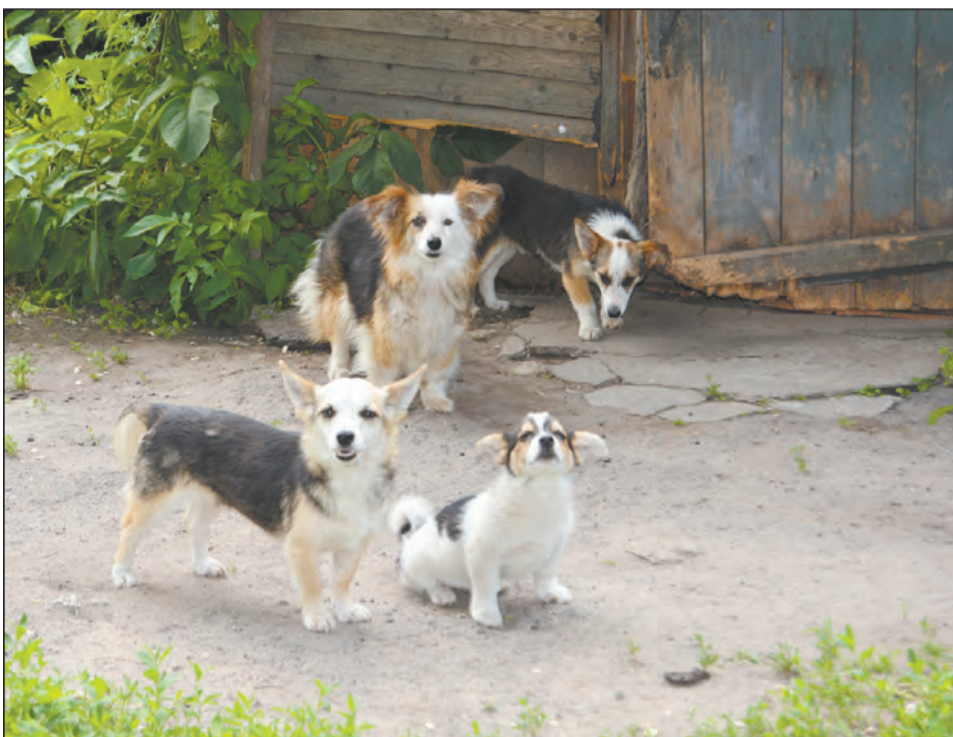
Громким лаем собаки встречают каждого, кто заходит на подворье

Прошлой осенью фактически обрушилась одна из стен квартиры, поэтому в конце прошлого года этих людей временно, до прихода тепла, поселили в пустующее административное здание. Там они находятся и поныне. В помещении отсутствует природный газ, отключена подача света. С этими людьми неоднократно пытались проводить беседы, в том числе и по доведению до них правил содержания животных на территории поселения, в целом их будущей жизни. Однако они практически не идут на контакт, предпочитают жить так, как и до этого.