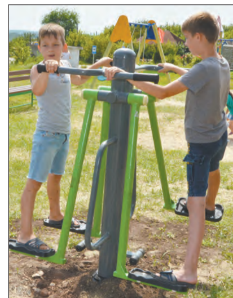
В Перещепном установили еще и тренажеры

Одну из самых крупных и дорогостоящих площадок на прошлой неделе начали устанавливать на улице Луговой города Богучара, которую, кстати, в 2019 году признали лучшей улицей в частном секторе в региональном конкурсе «Уютный дом». На установку площадки местный ТОС №6 выиграл грант на сумму 885