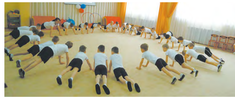
Воспитанники детского сада «Солнышко» выполняют силовые упражнения

Ребята поучаствовали в некоторых испытаниях на гибкость и выносливость