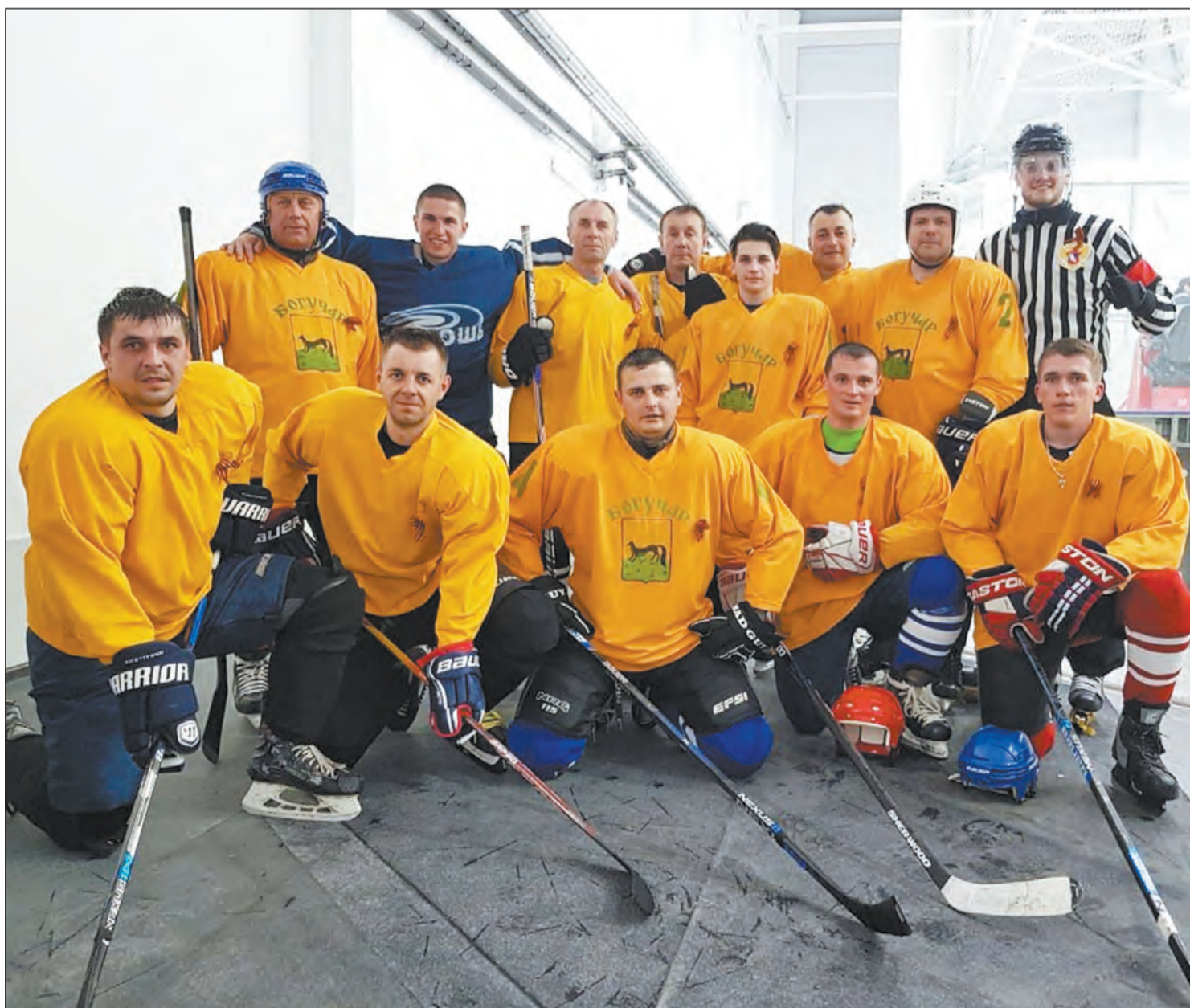
«Бронза», завоеванная на турнире в Ровеньках, тоже очень радует

На межобластном турнире наши хоккеисты стали призерами