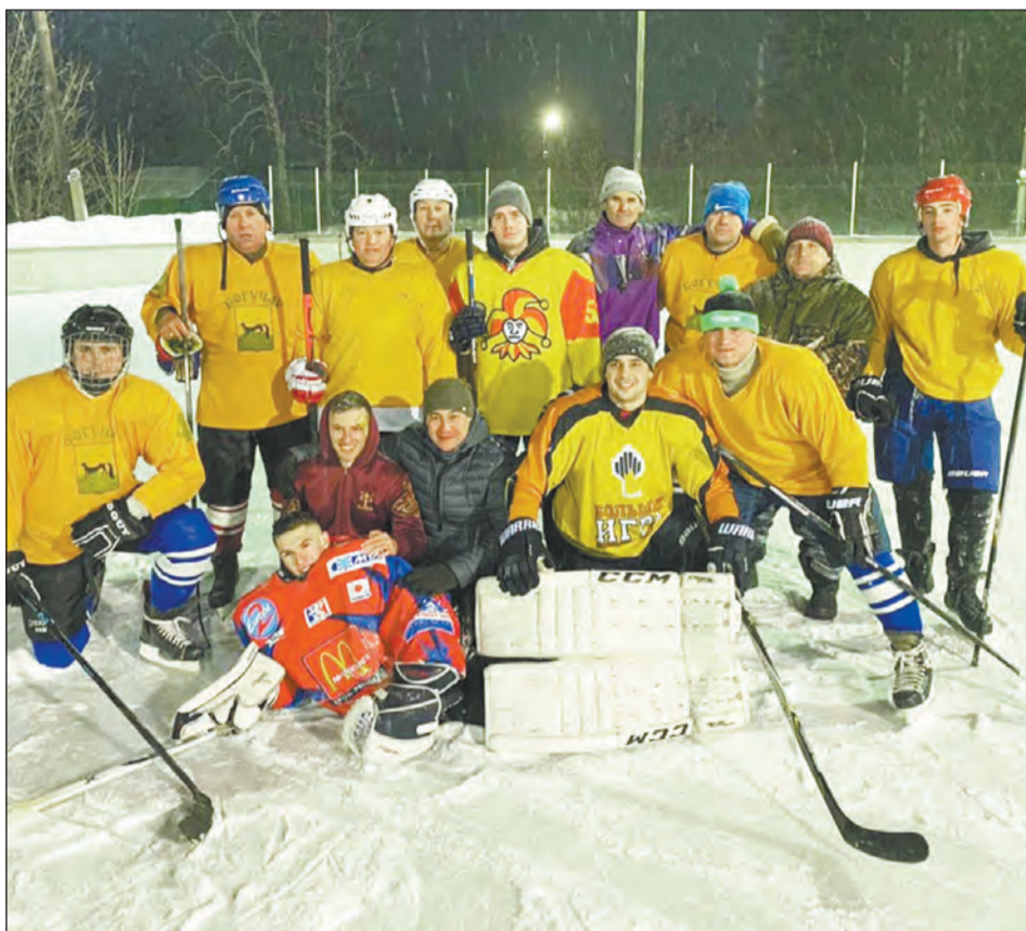
Веселое настроение у команды после победы в одном из зимних турниров

Как правило, в течение каждого сезона команда участвует в 6-8 турнирах, на которых проводит до двух десятков полноценных игр. Нередко бывает, что в один день приходится играть две встречи, это не просто в первую очередь в физическом отношении. Ведь богучарские хоккеисты не профессиональные спортсмены, кто-то, например, накануне соревнований вернулся из дальней поездки, другим, наоборот, вечером заступать