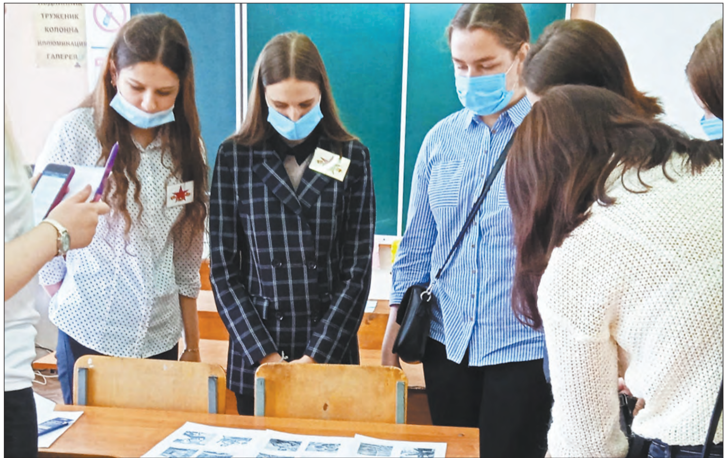
■ Испытания были непростые, но молодые люди с ними справились.

Ребята стали лучшими в областном конкурсе