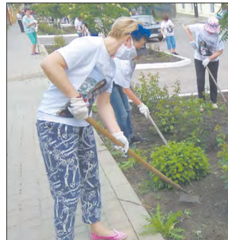
Жители вышли на субботник

– Пользуясь случаем, хотел бы еще раз призвать всех жителей частных домов навести порядок. Это также касается и прилегающих территорий организаций и предприятий всех форм собственности. Причем не только навести, а постоянно его поддерживать. Любить свой родной город не на словах, а на деле,