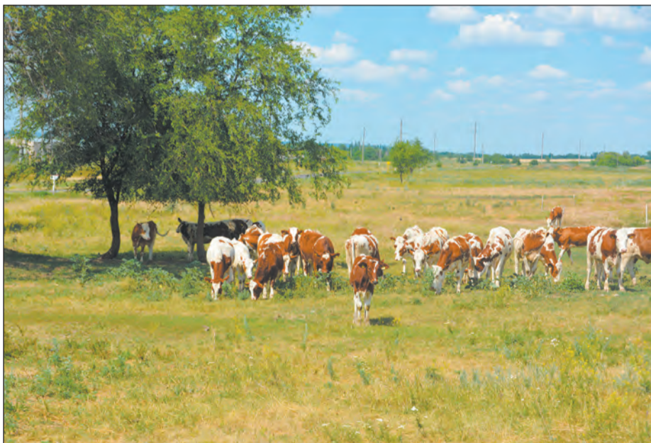
На Полтавской ферме животным есть где укрыться от палящего солнца

Рабочим животным необходимо давать достаточно времени на отдых, своевременно поить их прохладной (около +20°C) водой. Рекомендуется снизить нагрузку и сократить рабочее время на период жаркой погоды. По возможности изменить рабочий график: больше работать в утренние и вечерние часы, а