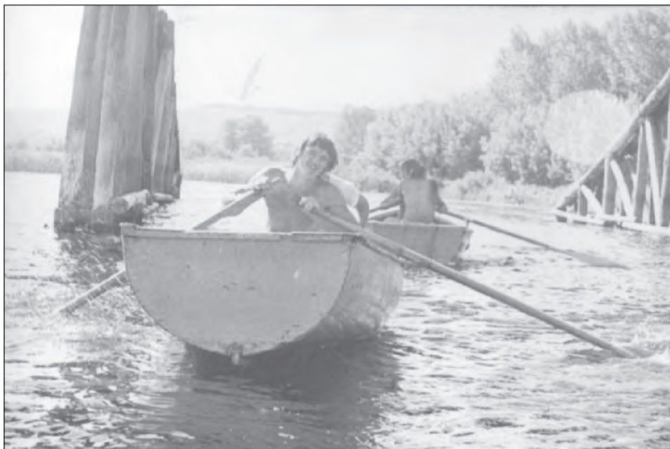
Под мостом через Богучарку обычно проплывали между вторым и третьим ледорезами

Богучарская молодежь отдыхала на реке, играла в футбол, за один вечер успевала побывать на танцах и в Богучаре, и на Залимане