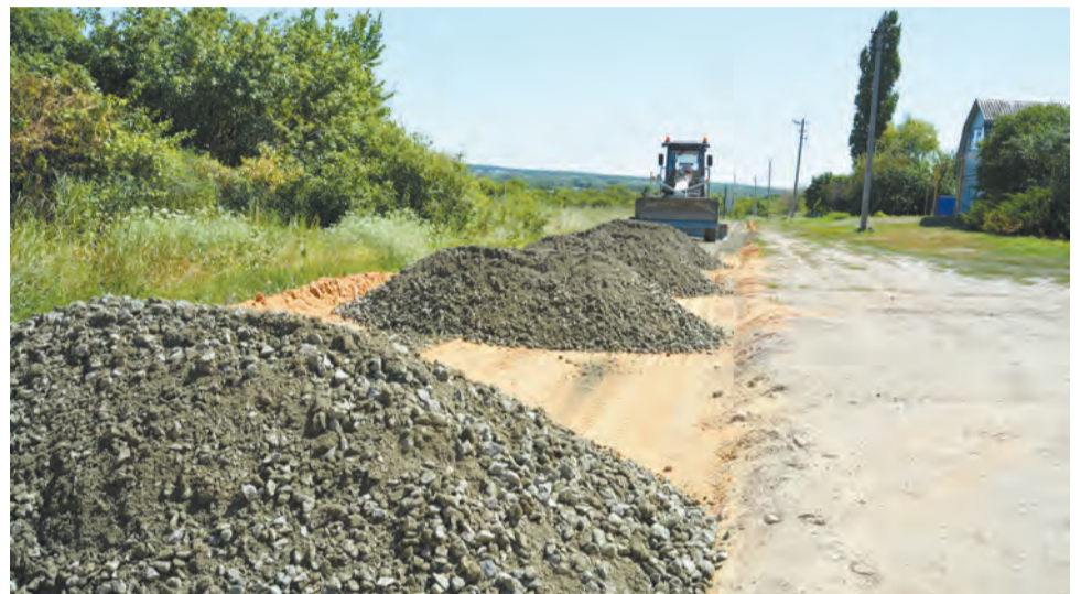
Укладка щебня идет на улице Школьной в Монастырщине