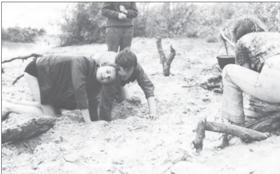
Видимо ищут то, что накануне закопали

Еще немного о футболе. В те времена в Богучаре летом стихийно образовались несколько детских футбольных команд. Они были на улицах Кирова, Набережной, 1-е Мая, Лысогорке и микрорайоне Песковатка, в селе Залиман. Организаторами выступали ребята 13-14 лет, которых хорошо знали на стадионе «Урожай». Они приносили со стадиона мяч, иногда несколько комплектов формы, и разномастная уличная команда, возраст игроков в которой составлял от шести до 14 лет, порой через весь город отправлялась на матч. Уличные команды, как правило, появлялись благодаря наличию футбольной площадки, пусть и небольших размеров. Ее не было только у команды с улицы 1-е Мая, однако это не мешало юным футболистам-первомайцам побеждать чаще остальных.