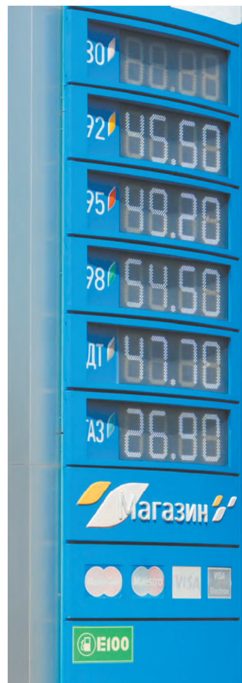
Цены на основные виды топлива с января по апрель 2021 года (руб./л)