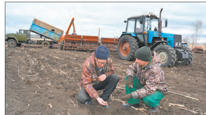
Полеводы проверяют качество сева ячменя