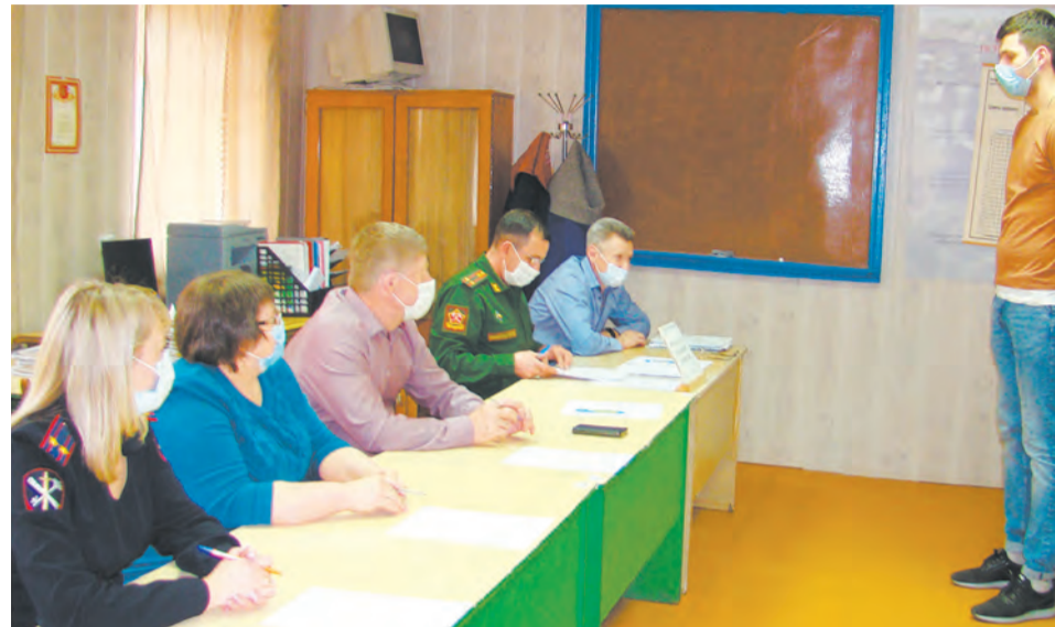
Очередной новобранец прибыл на призывную комиссию

19 апреля в районном культурно-досуговом центре детей и молодежи прошел День призывника. На мероприятии