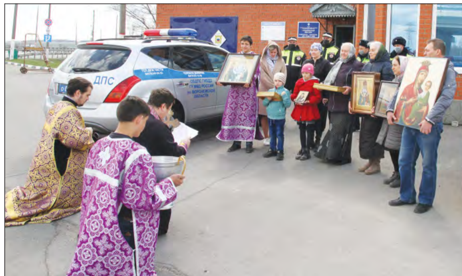
Православные верующие во время молитвы на посту ДПС

Наталья ЛИФИНЦЕВА