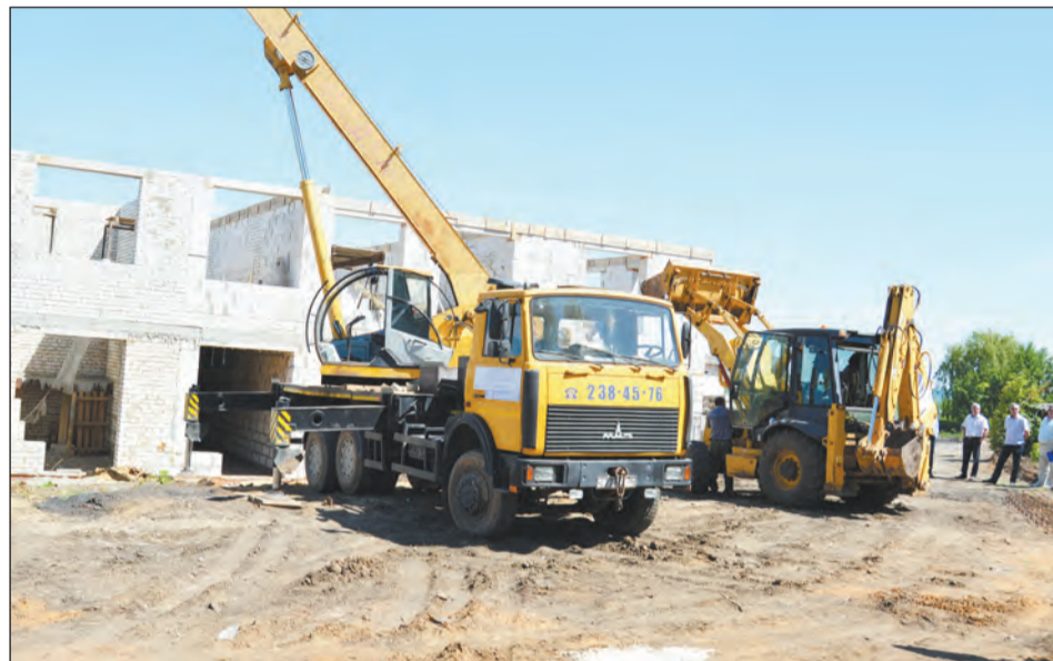
Строительство детского сада ведется в рамках национального проекта «Демография»

Однако в результате контроля строительства специалисты администрации Богучарского района обнаружили несоблюдение подрядчиком сроков выполнения отдельных видов работ, что может привести к срыву своевременного ввода