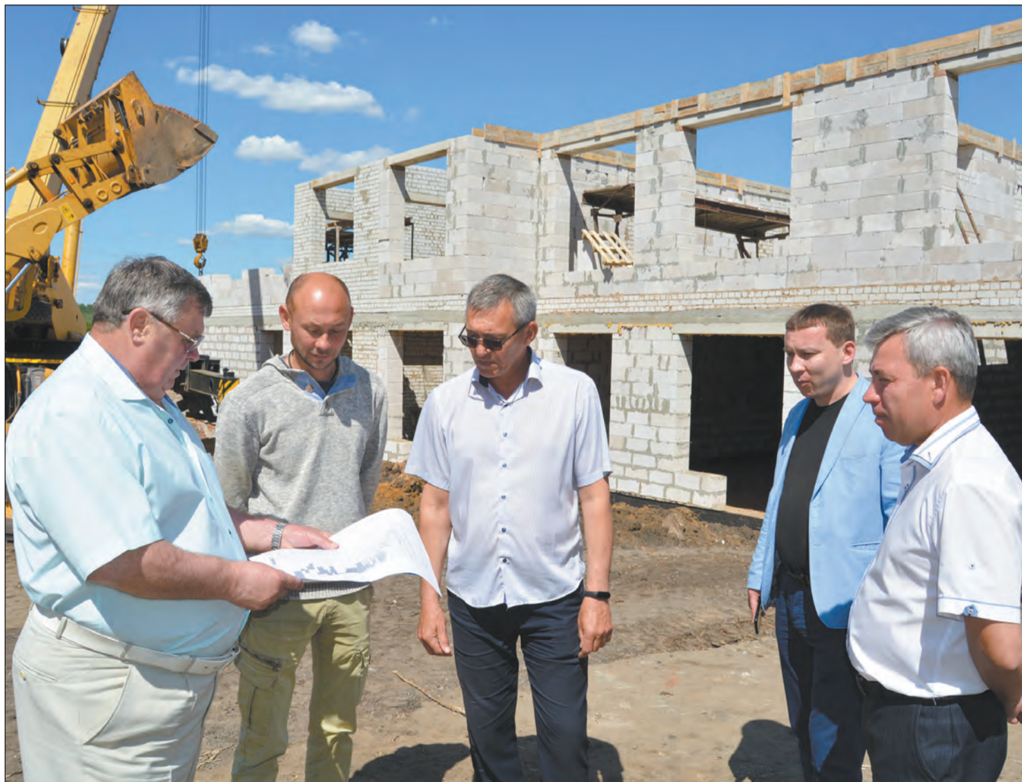
Участники совещания проанализировали график выполнения работ на стройке

Администрация Богучарского района установит за подрядчиком жесткий контроль