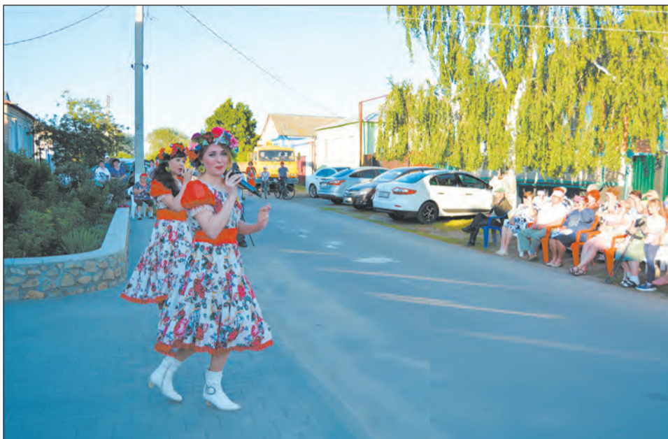
Солистки ансамбля «Весенние зори» порадовали жителей улицы веселыми песнями