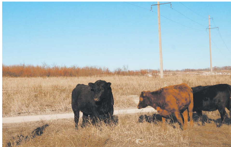
Животные-новоселы обживают новое место

шом стаде заправляет годовалый бычок Миша. Нетели немного постарше, к середине весны ожидаются первые приплоды. В кормушках в достатке сена, в регулярном рационе у животных также семена подсолнечника, дробленый ячмень, раз-