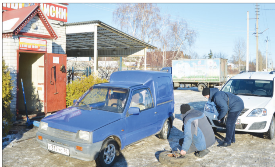
Очереди в пунктах шиномонтажа пока сохраняются