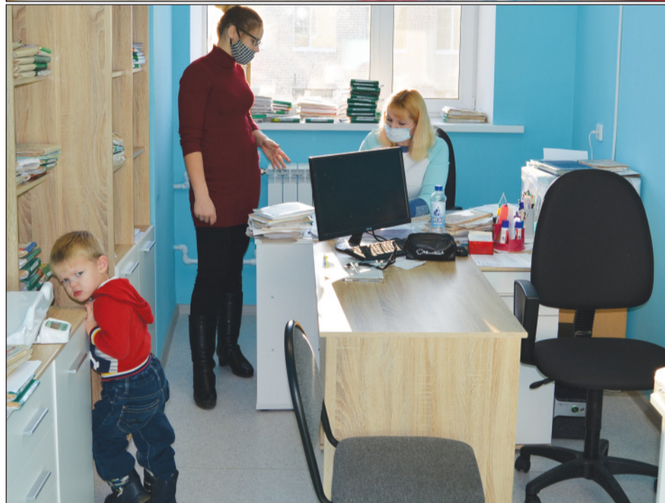
■ В кабинетах стало очень уютно