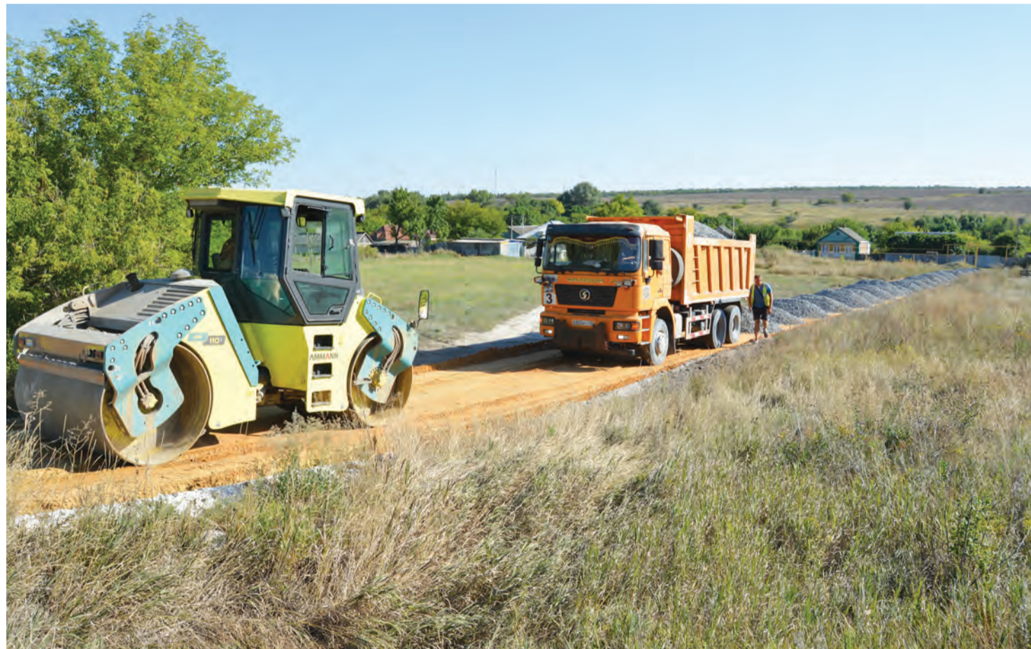
Завершаются последние приготовления перед укладкой асфальта

На одной из улиц в Монастырщине в скором времени появится асфальтовое покрытие