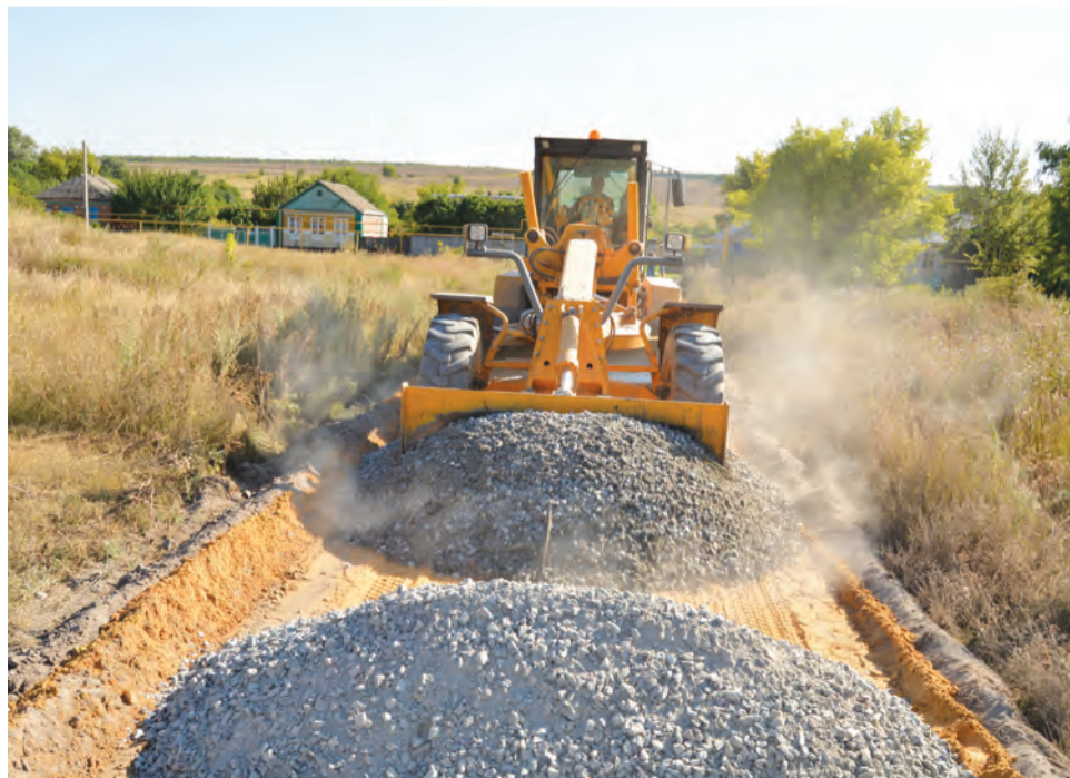
Идет подготовка съездов к улице Свободы