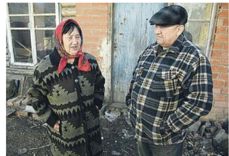
Во времена СССР в Студенке бурлила жизнь