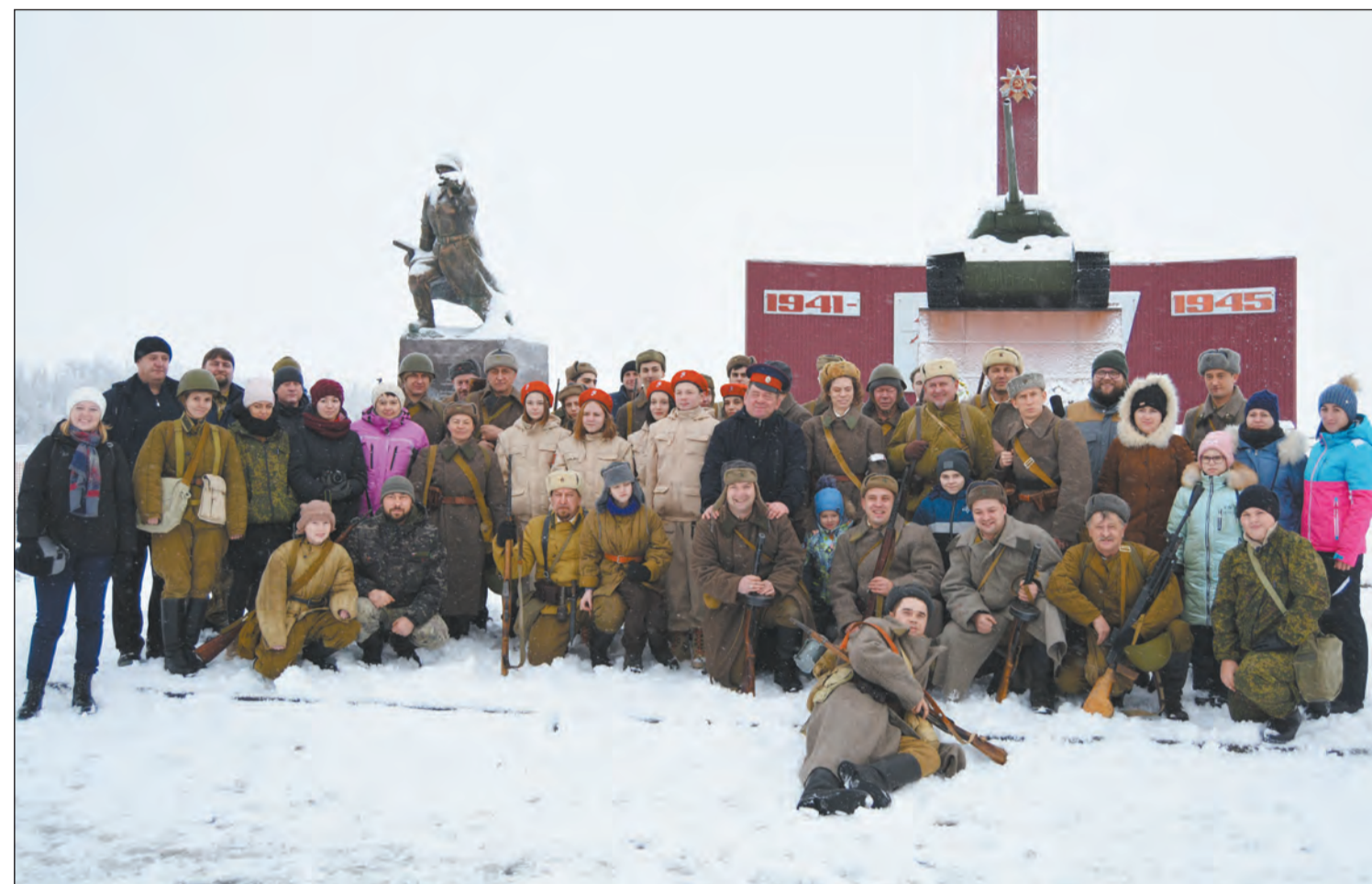
Участники пешего похода и реконструкции исторических событий сфотографировались у мемориала «Среднедонской наступательной операции»