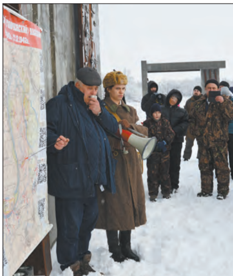
■ Экскурсия по Осетровскому плацдарму

На мемориальном комплексе «Осетровский плацдарм» для всех участников памятного события внештатный сотрудник