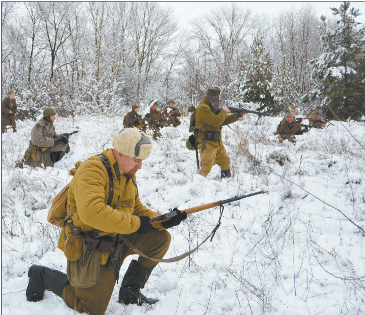
Отделение реконструкторов боя развернулось в цепь

Участники похода воспроизвели исторические события наступательной операции «Малый Сатурн»