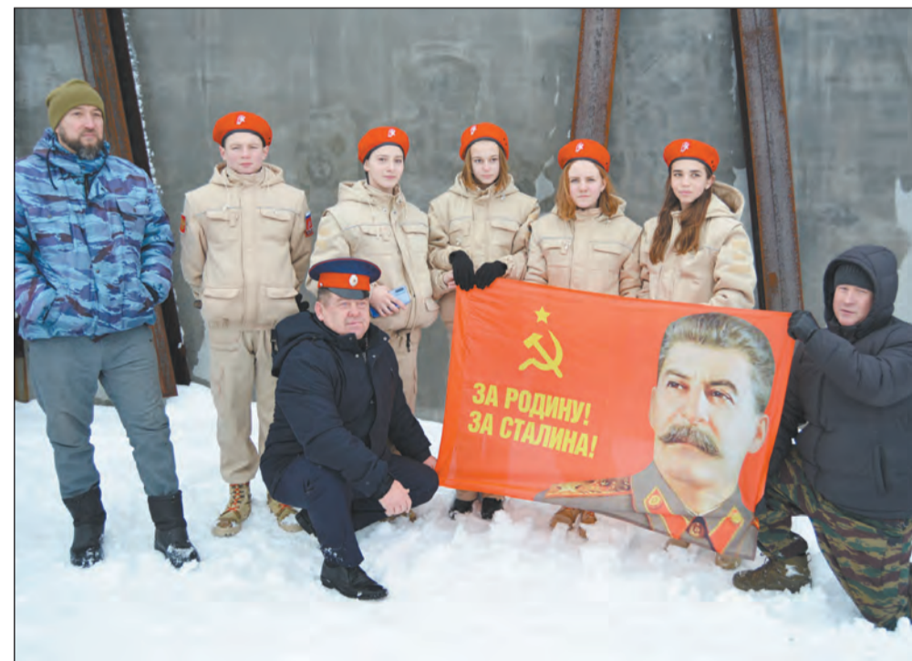
Юнармейцы Песковской средней школы Петропавловского района поучаствовали в реконструкции