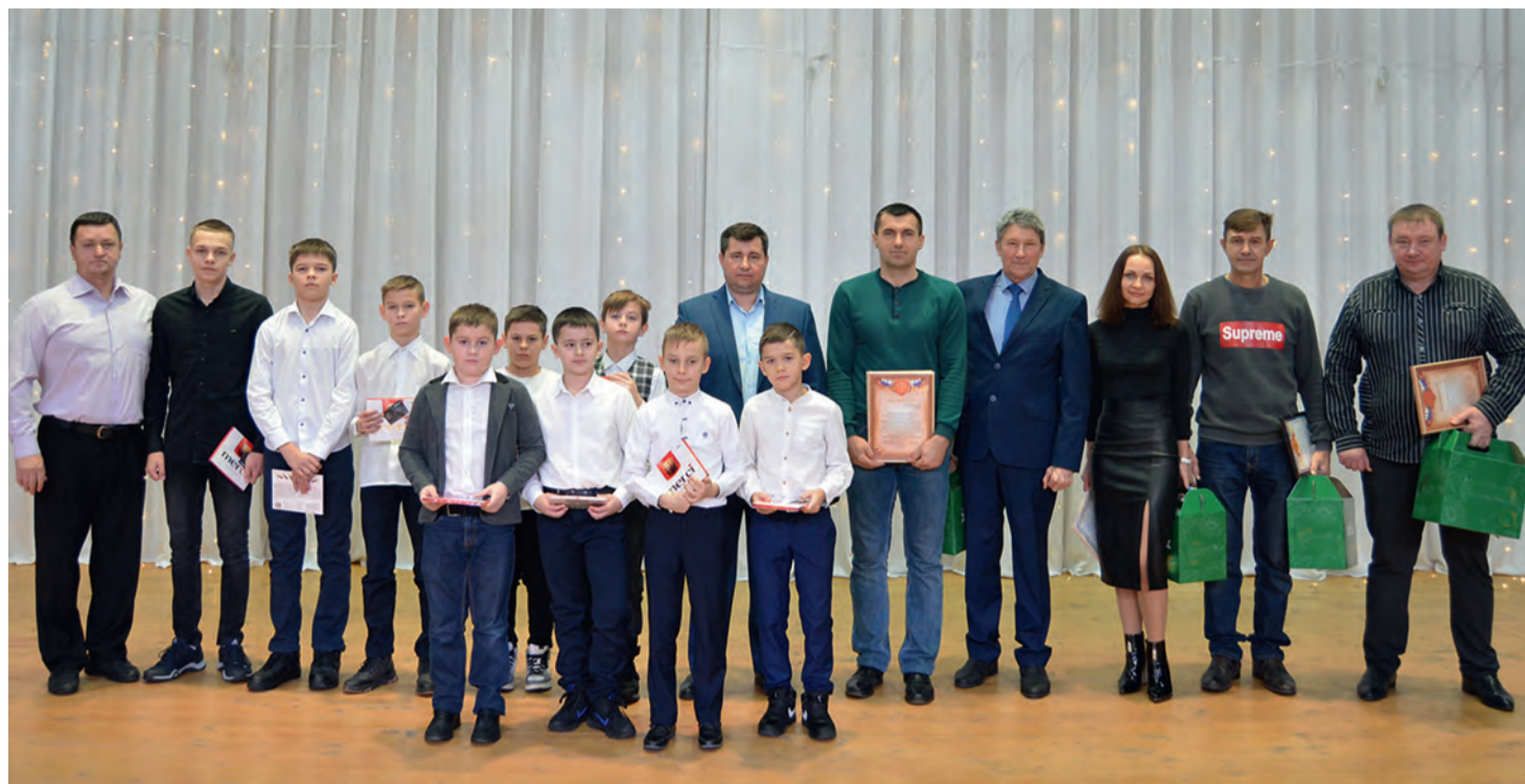
Больших успехов в 2021 году добились юные богучарские футболисты

Для вручения призов и поздравления ребят, занимающихся греко-римской борьбой, на сцену дворца культуры