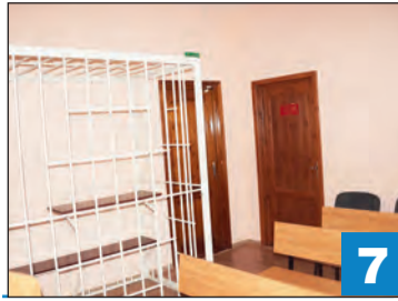
Чем завершилась давняя история о стрельбе в милиционера