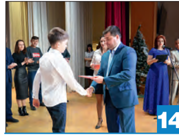
В Богучаре наградили лучших спортсменов