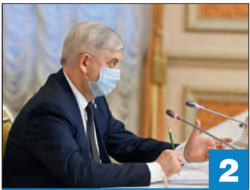
Губернатор провел совещание по оперативной обстановке в регионе