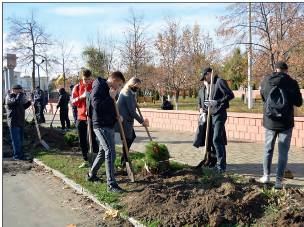
■ Студенты колледжа сажают горные сосны