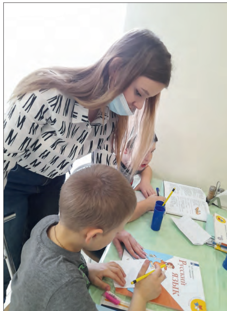
С дошкольниками занимаются будущие воспитатели

Наталья ЛИФИНЦЕВА