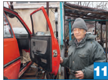
Почему наш земляк 60 лет назад обращался на рижский завод