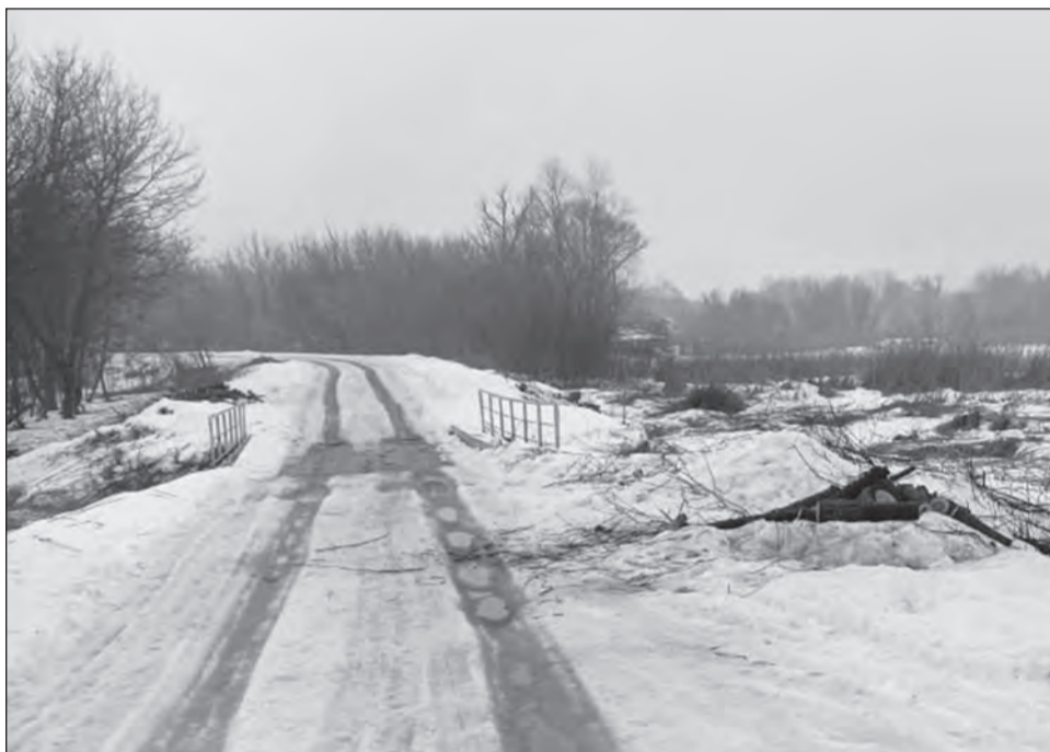
■ Фото сделано в процессе уборки территории моста