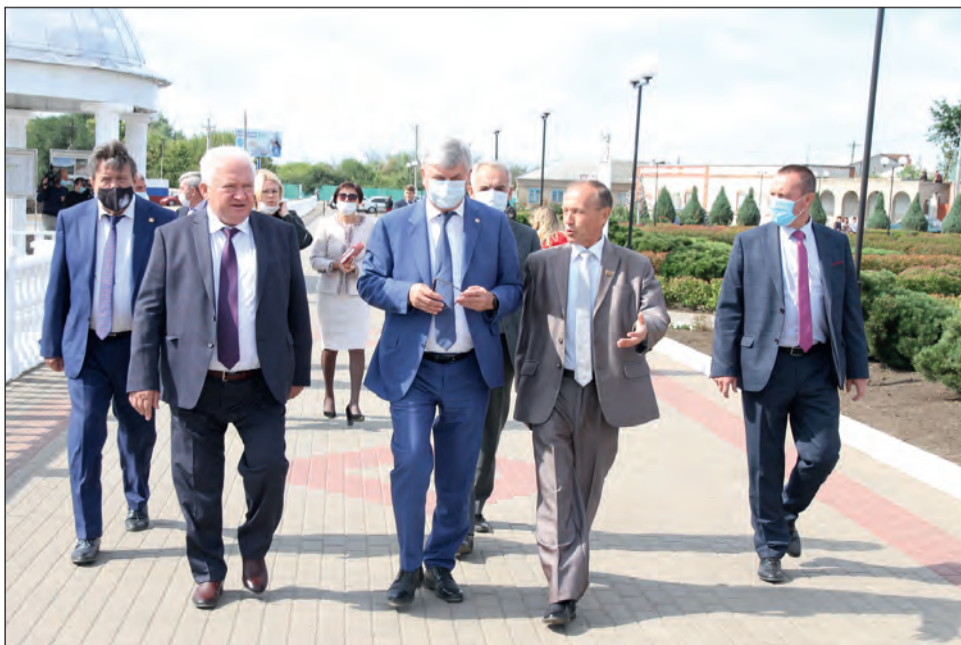
■ Губернатор Александр Гусев знакомится с ходом благоустройства набережной в Богучаре

В 2021 году администрация города заключила муниципальный контракт по ремонту автомобильных дорог, в результате чего в Богучаре отремонтировали автодороги общего пользования местного значения на улицах Набережная, Верхняя, Ленина, Таши Поповой, Радченко и отсыпали щебнем улицы Береговую, Дачную и проезд от улицы 27 февраля до улицы Мира. Подрядная организация выполнила