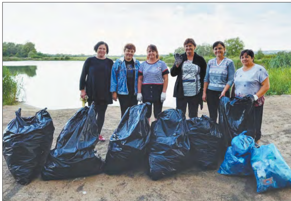
Фото на память после завершения экологической акции в селе Дьяченково

– Не сложно догадаться, что все это оставляют после себя отдыхающие. Такое отношение к природе – результат отсутствия воспитания. У меня сын поехал