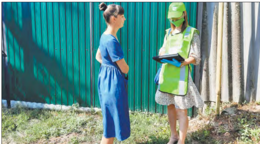
■ Переписчик общается с жительницей одного из сел района