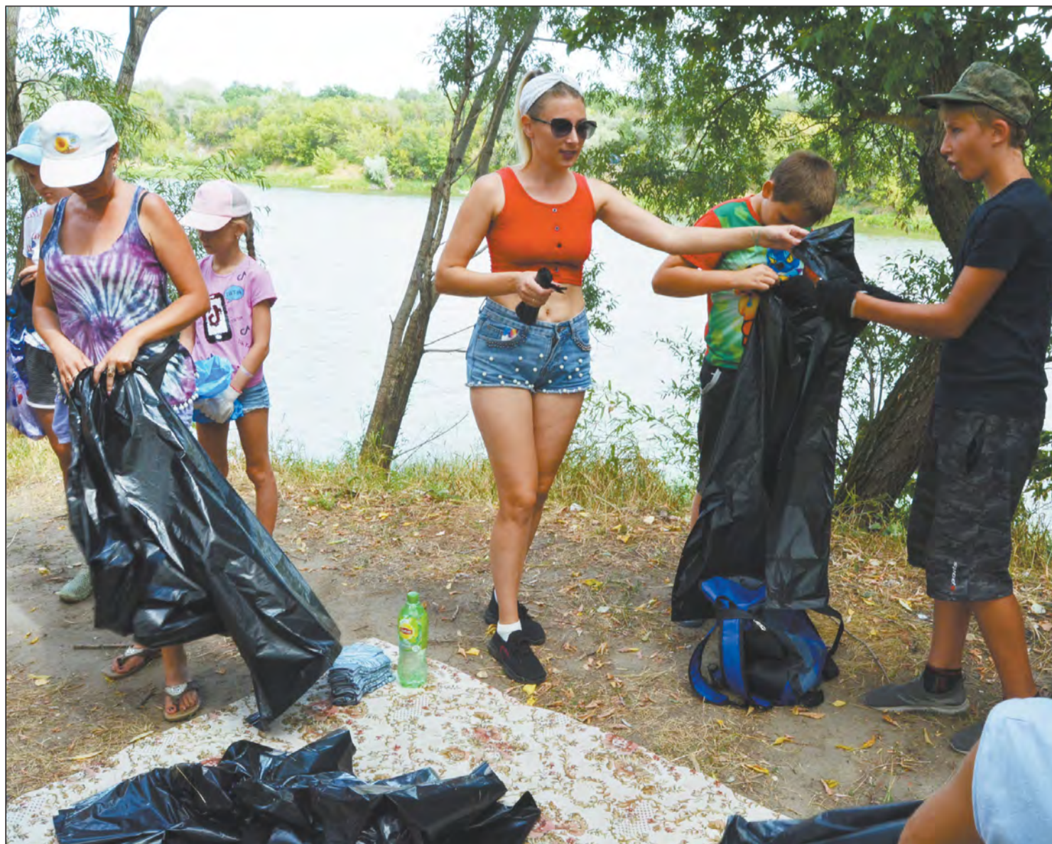
Организационный момент перед началом акции в селе Терешково

Активисты навели порядок на берегах реки в селах Богучарщины