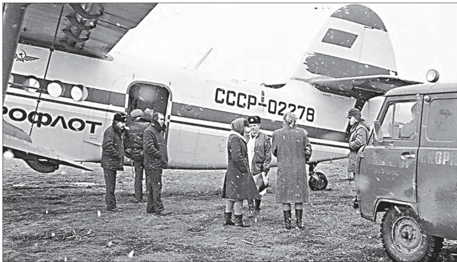
Первые вылеты сотрудников Центра медицины катастроф проходили в непростых условиях

Врач и фельдшер Центра медицины катастроф рассказали о том, как спасли тысячи людей