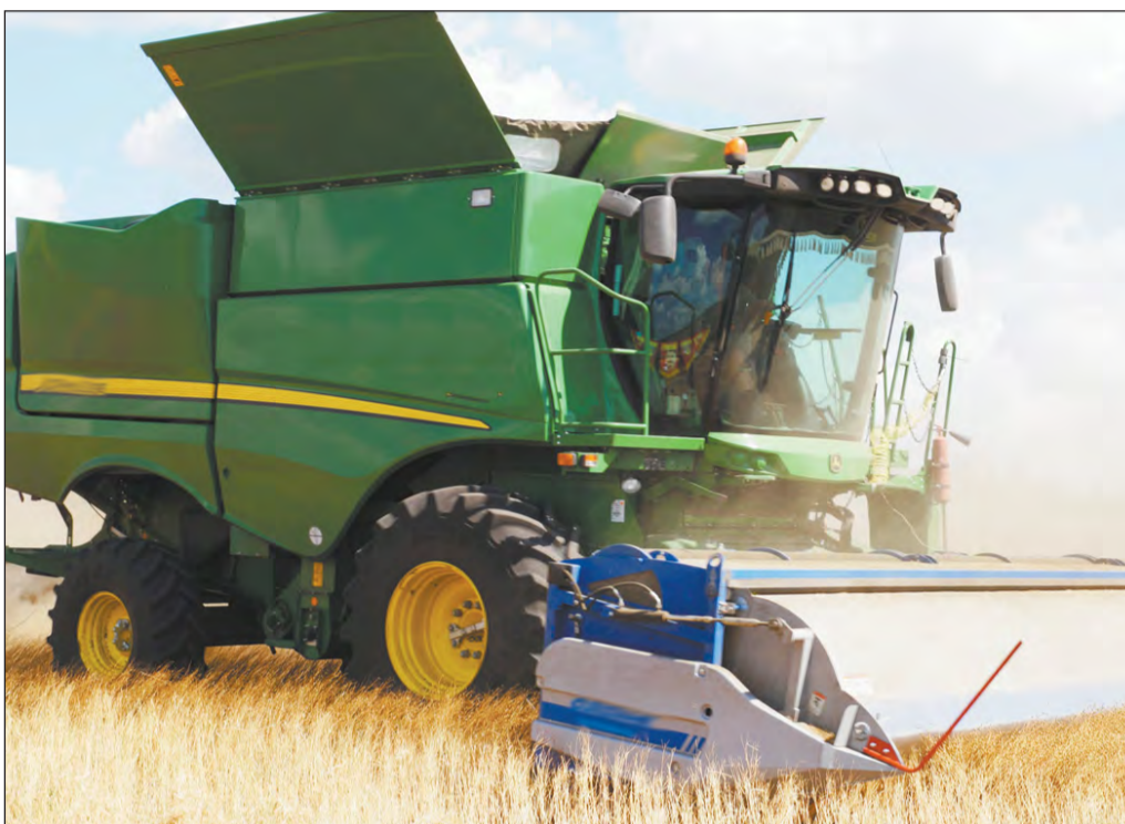
Уборочный комбайн работает на одном из дальних льняных полей

Богучарские сельхозпроизводители с каждым годом все больше площадей выделяют под лен