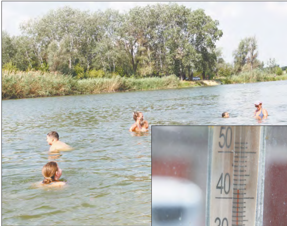
■ Купание в реке – один из способов охладиться, которым нередко пользуются богучарцы

ледяной, чтобы она была где-то градусов 15-16. Можно положить на лоб влажную ткань. Дайте простейшие жаропонижающие таблетки. И пусть человек полежит. Но смотрите внимательно, если у него открывается рвота, следует повернуть на бок, чтобы не захлебнулся.