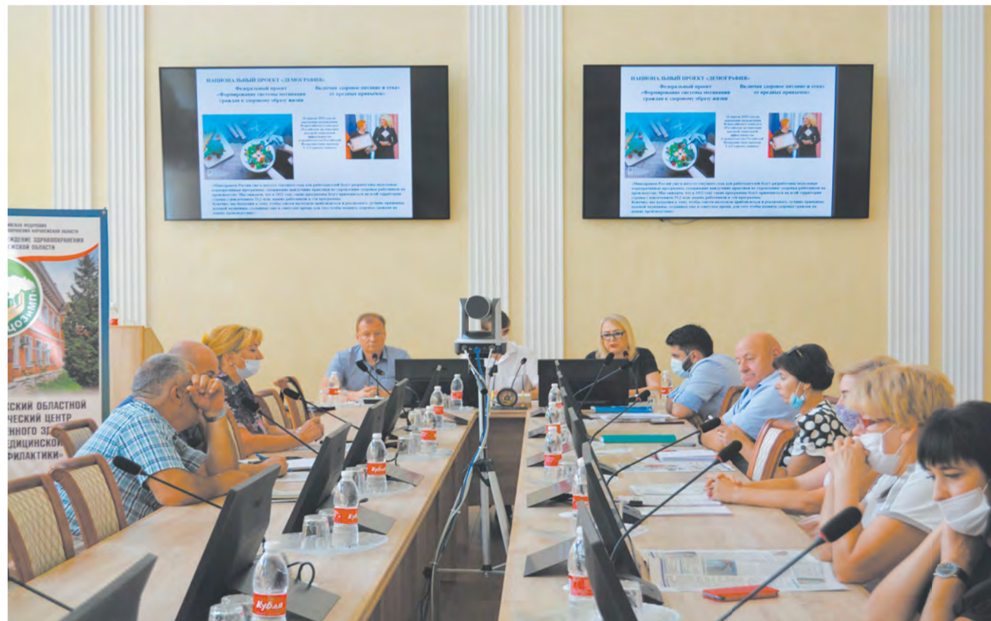
На мероприятии обсудили направления корпоративных программ по укреплению здоровья работающих граждан

Специалисты областного медицинского центра представили методические рекомендации для руководителей предприятий и учреждений